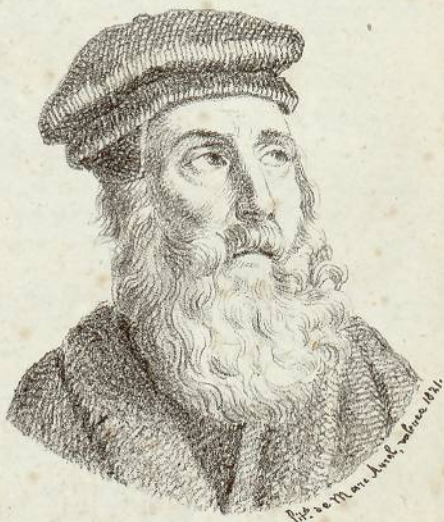
JEAN CALVIN .