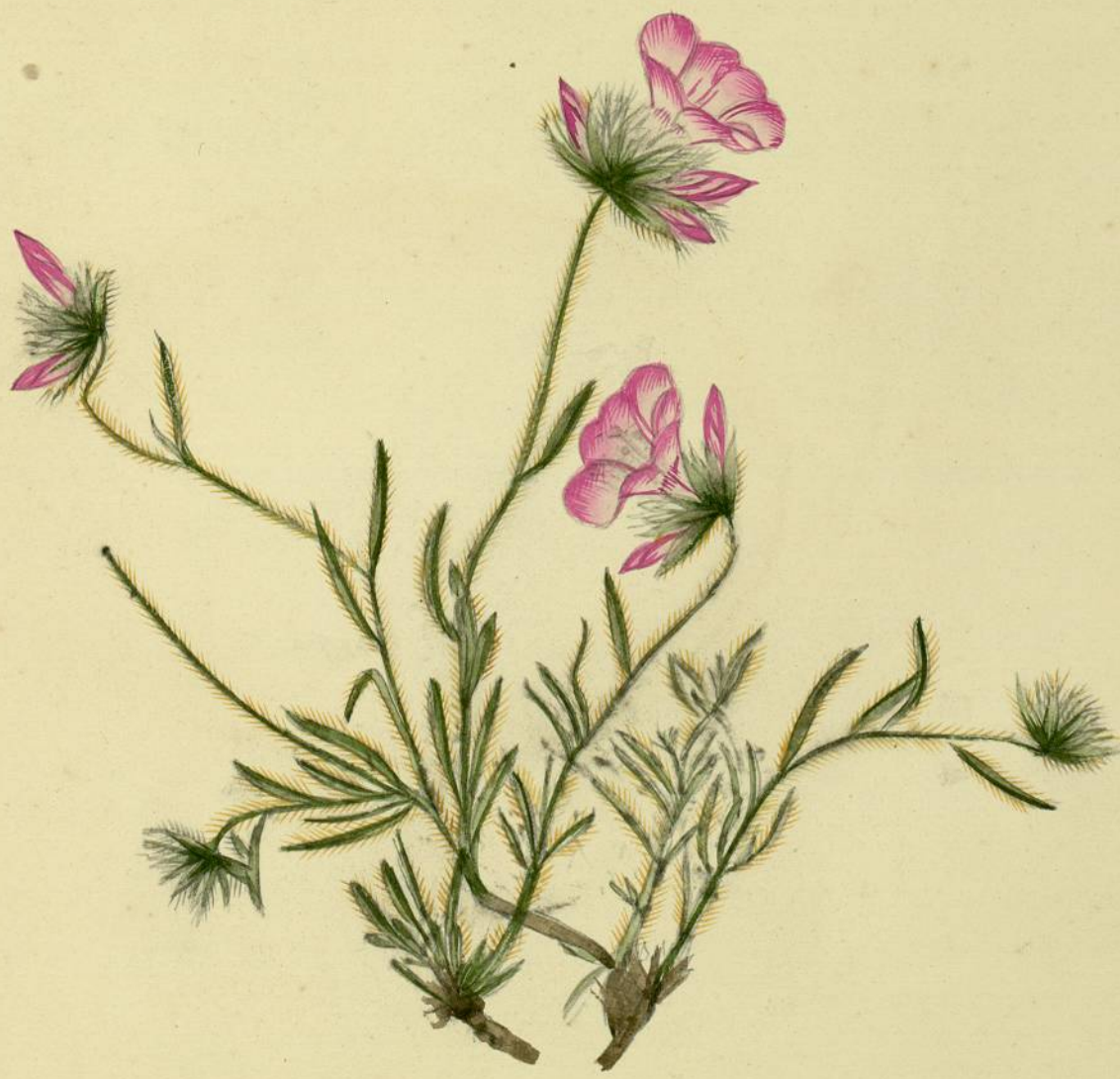
Consuelus lanuginosus. (Desfontaines) Titou.