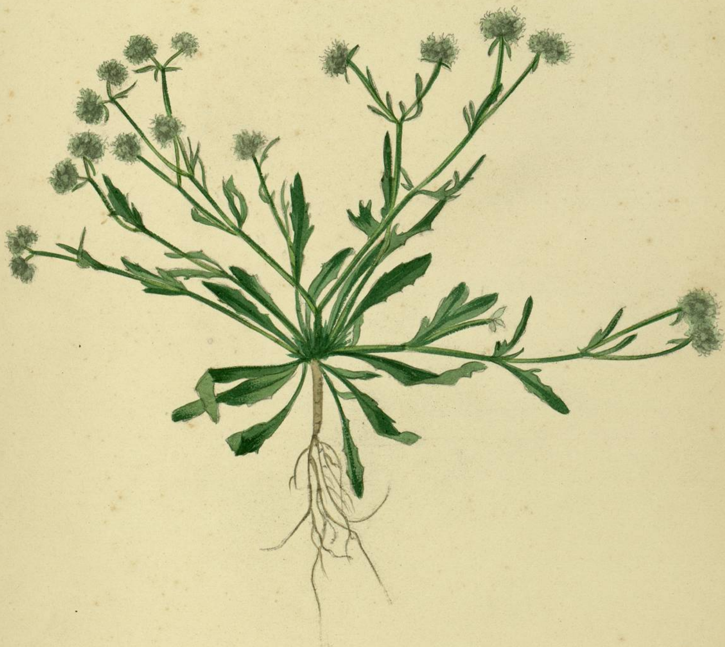
Valerianella coronata. (De Candolle.) Carcassonne, pelouses.