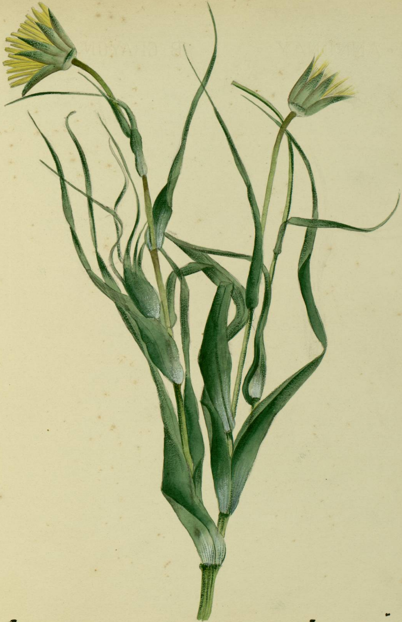
Tragopogon pratensis. (Linné.) Prairies de St. Jeanl.