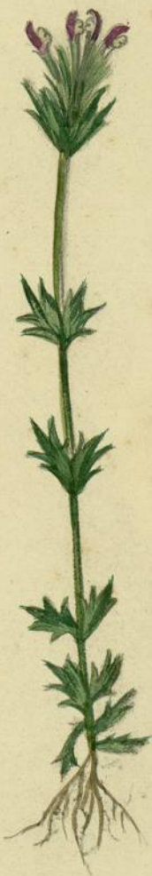
Eusfragia latifolia. (Griseb.) Carcassonne, endroits incultes.