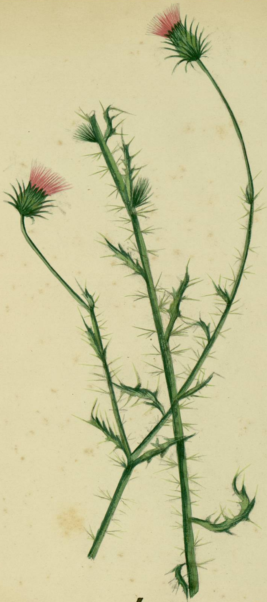
Carduus hamulosus. (Ehrhart.) Lespinassière.