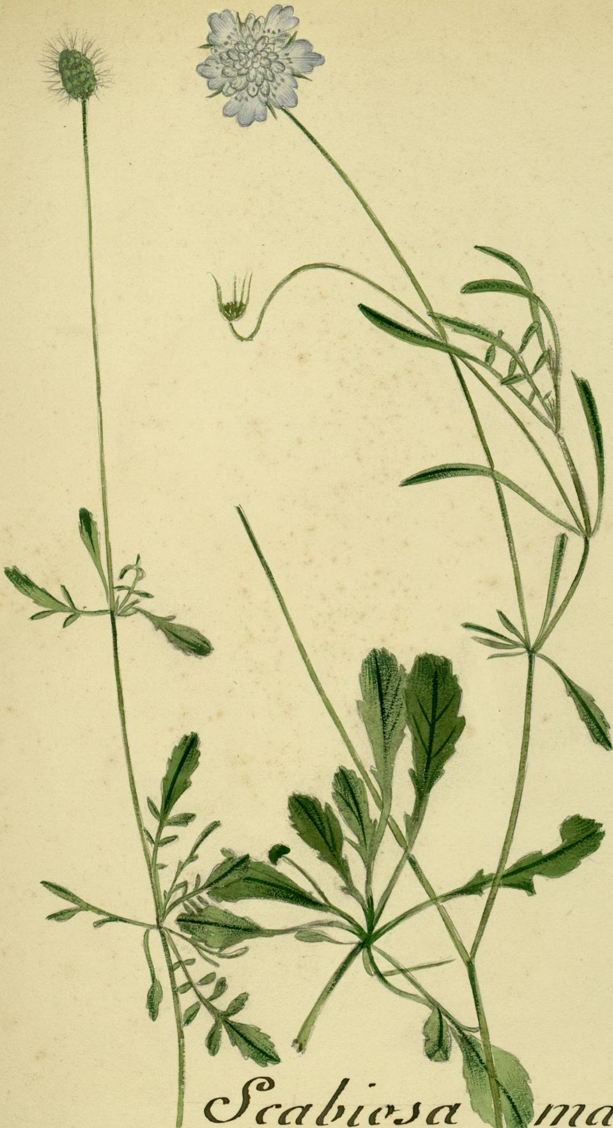
Scabiosa maritima. (L.) Bord des chemins Carcassonne.