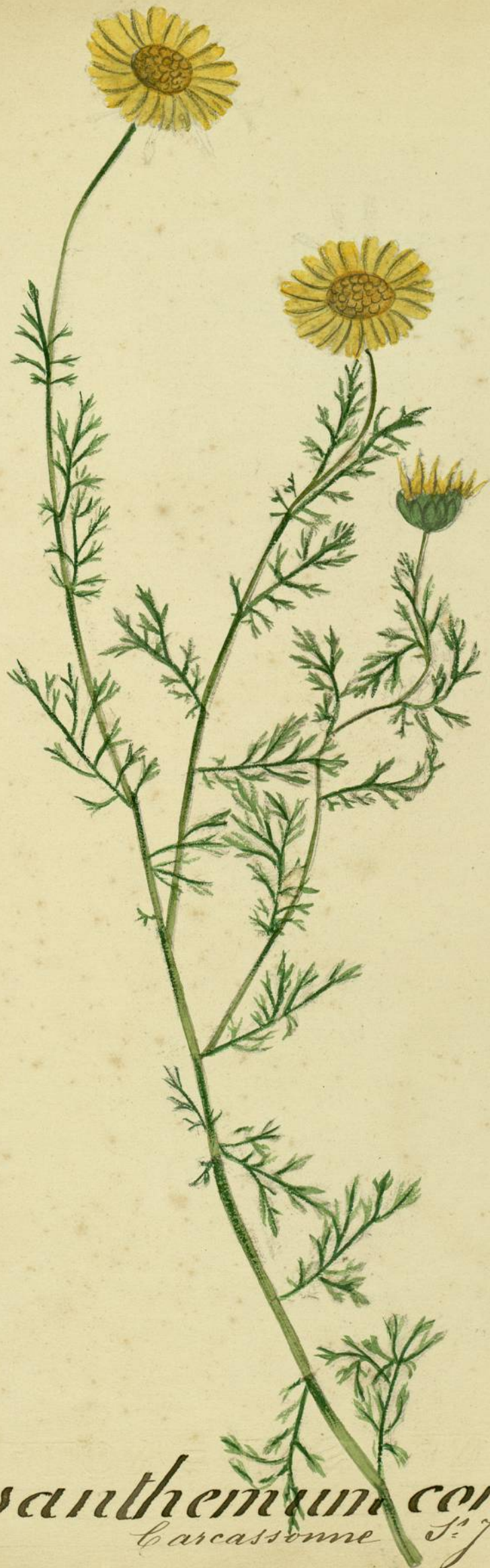
Chrysanthemum coronarium. (Linné.) Carcassonne S r Jean.