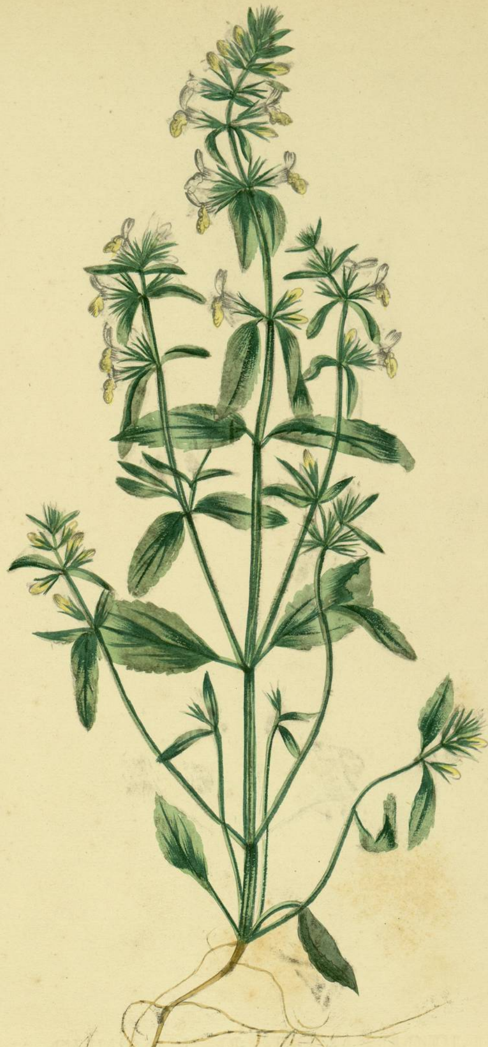
Stachys annua. (Linné.) Carcassonne, champs.