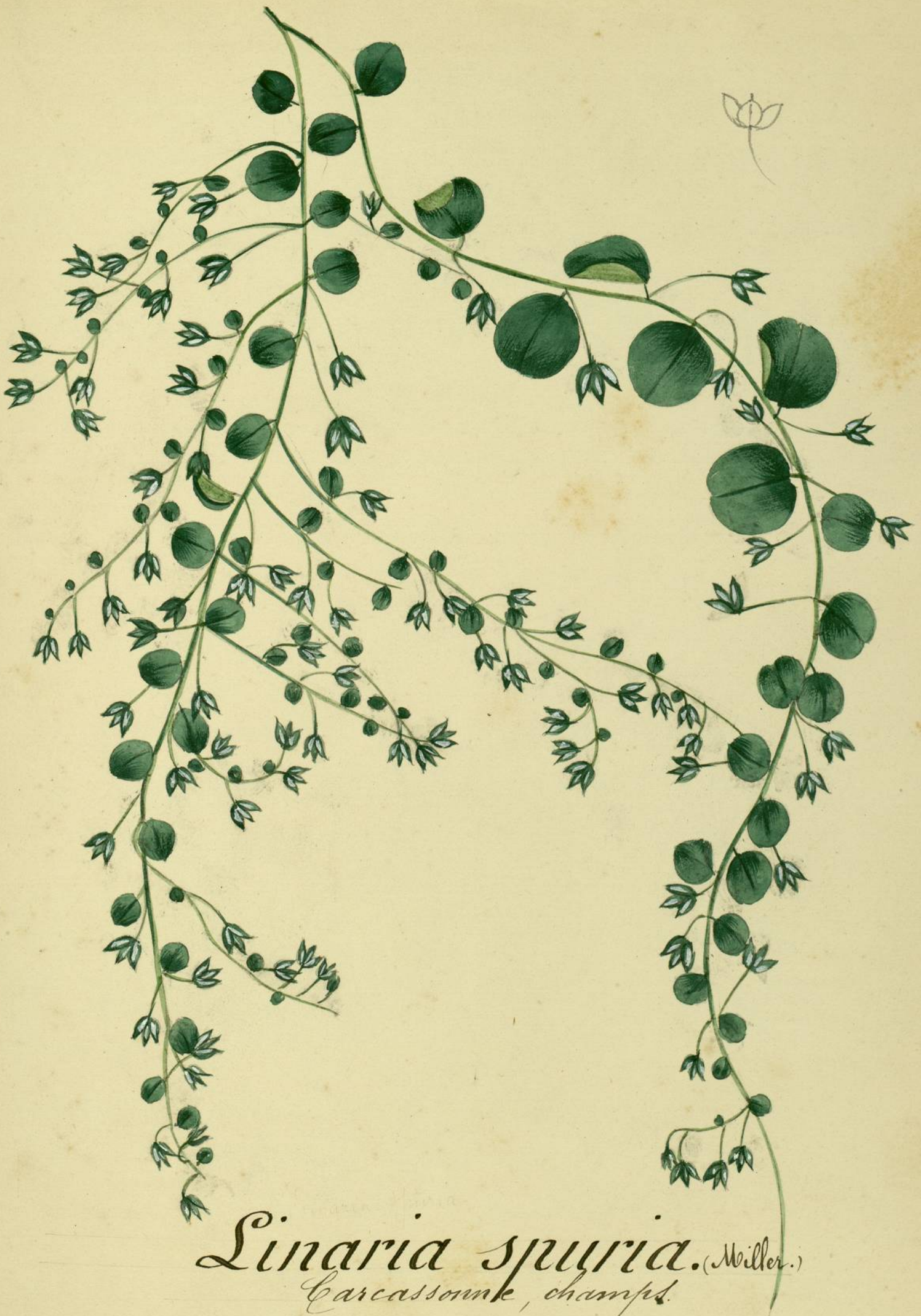
Linaria spuria. (Miller.) Carcassonne, champs.