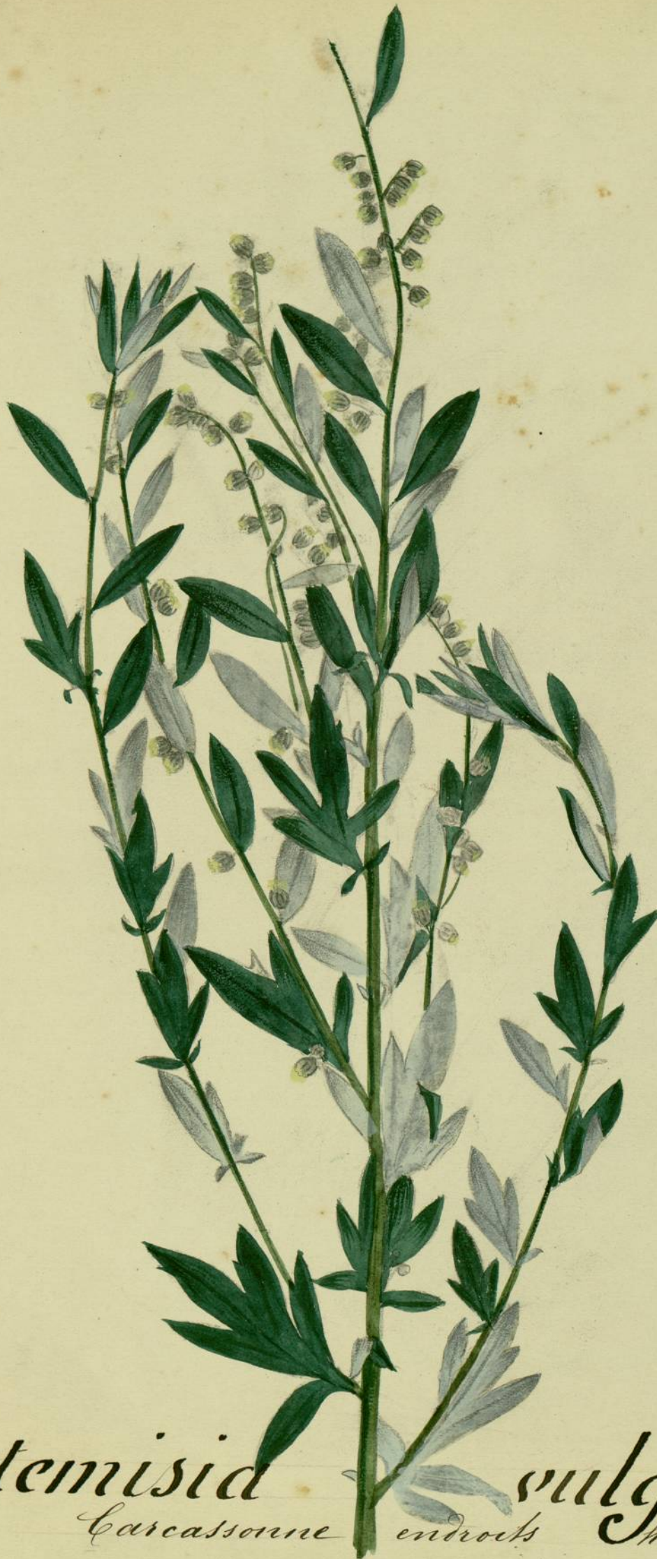
Artemisia vulgaris. (Linné.) Carcassonne endroits humides.