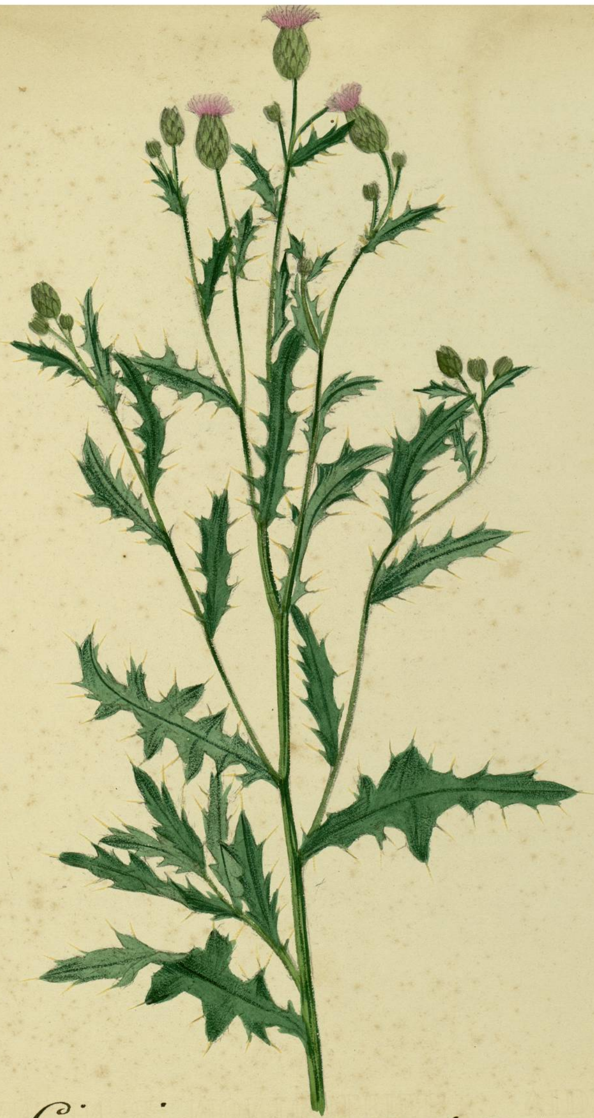
Cirsium arvense. ( Scopoli ) Carcassonne, champs.