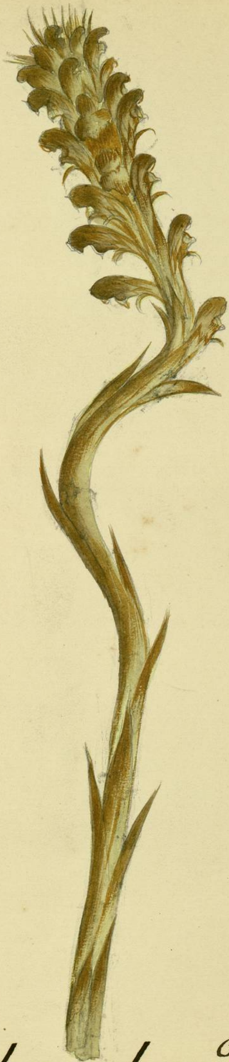
Orobanche Rajum. (Thuillier.) Montagne Noire, sur le Sarothamnus .