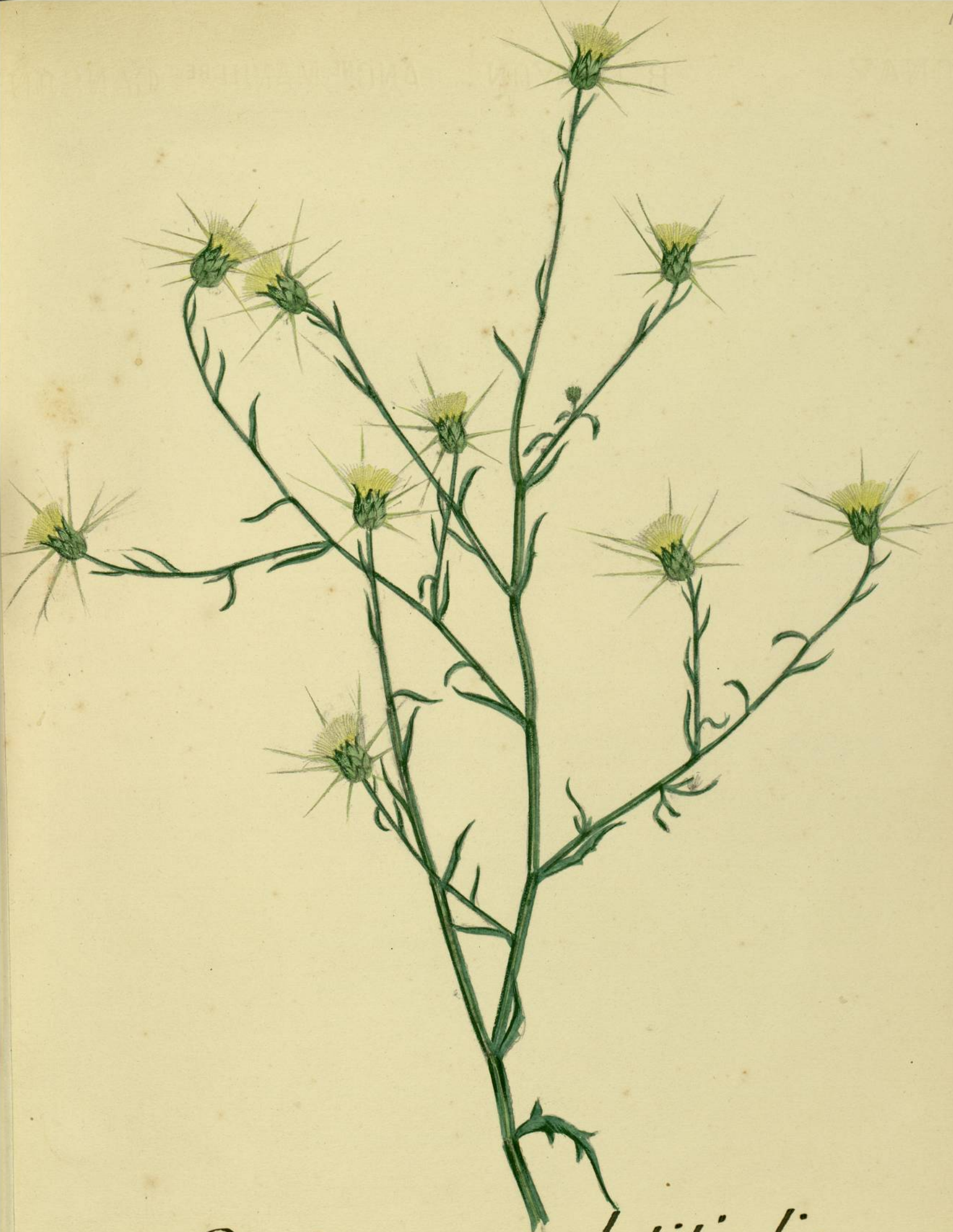
Centaurea solstitialis. (Linné.) Carcassonne, champs.