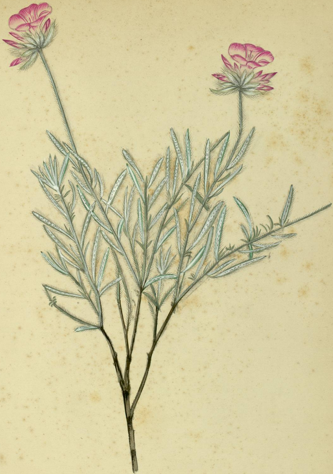
Consolida lanuginosa. (Desfontaines) variété linearis. (DeCandolle) Ile de Lante.