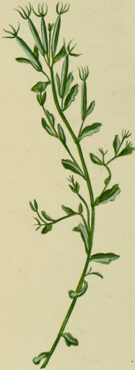
Specularia hybrida. (Alph. de Candolle.) Champs, Carcassonne.