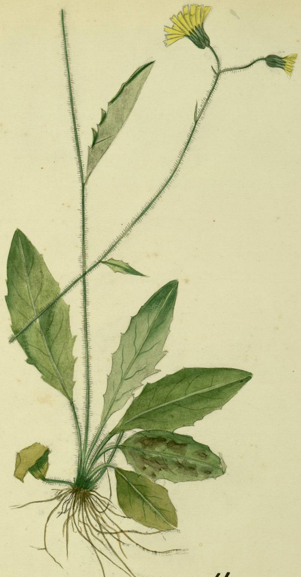
Hieracium pallescens. (Waldstein et Kitaibel. varieté hispidatum. (Arvet. Couvet.) Montolieu.