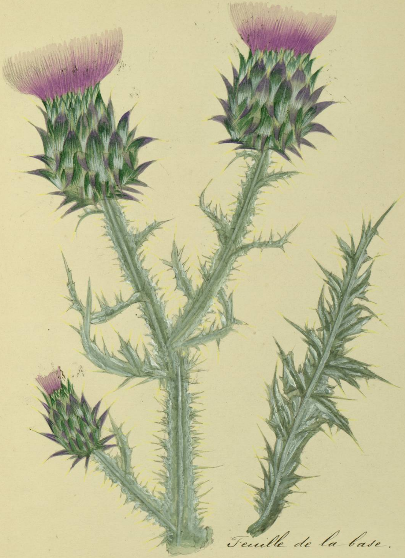
Feuille de la base.