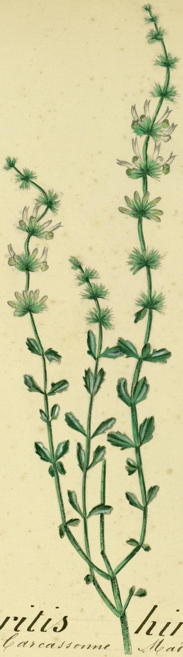
Sideritis hirsuta. (Linné.) Carcassonne Madame.