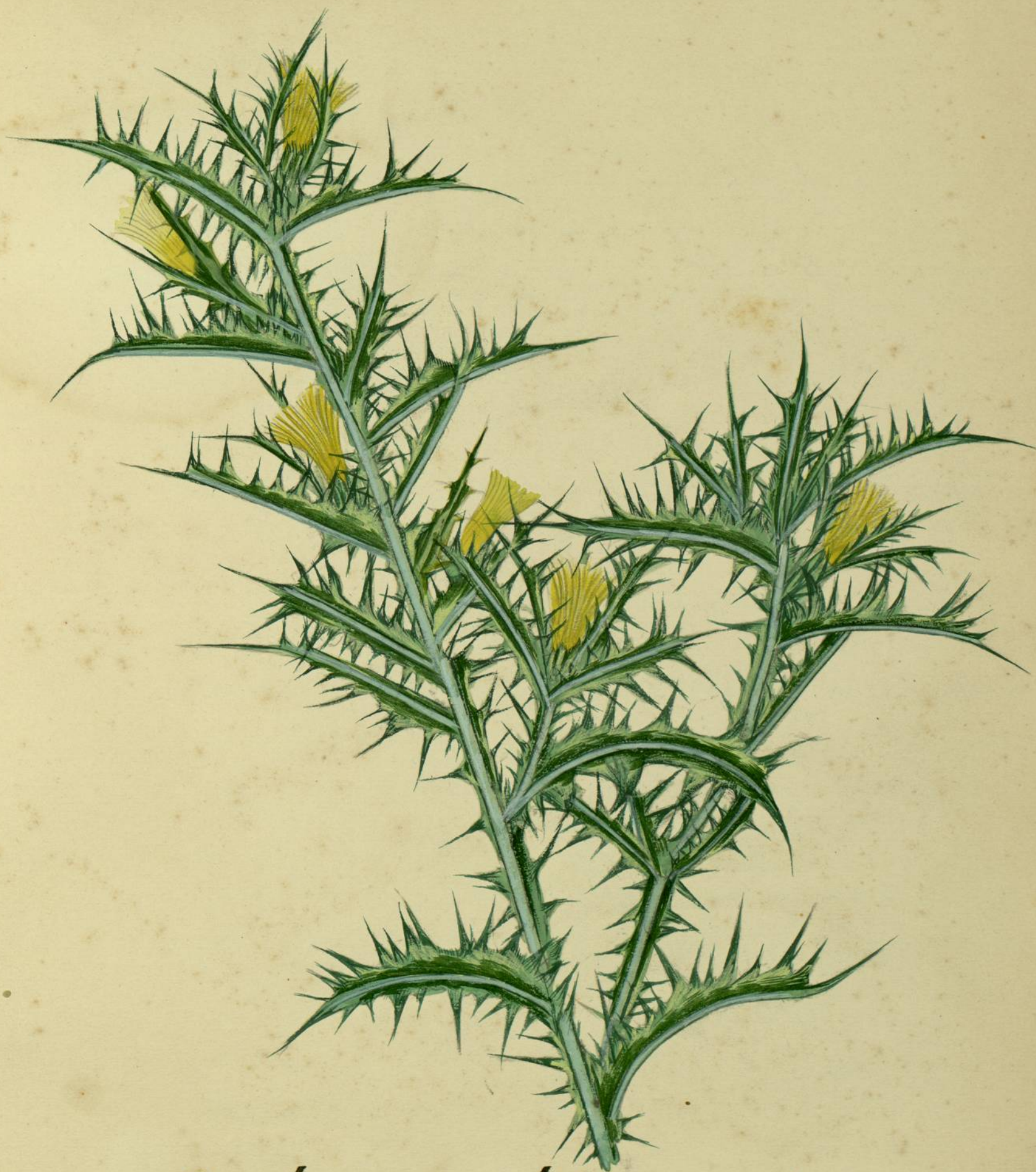
Scolymus hispanicus. (Linné.) Carcassonne, champs, endroits incultes.