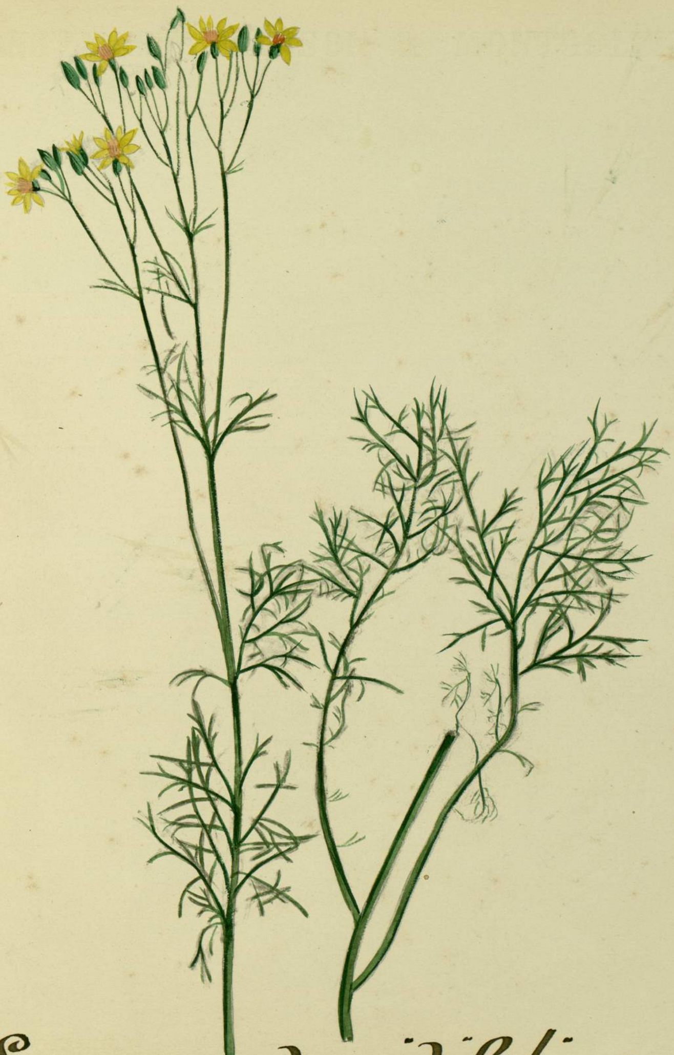
Senecio adonidifolius. (Foisencum Destouch.) Montagne Noire.