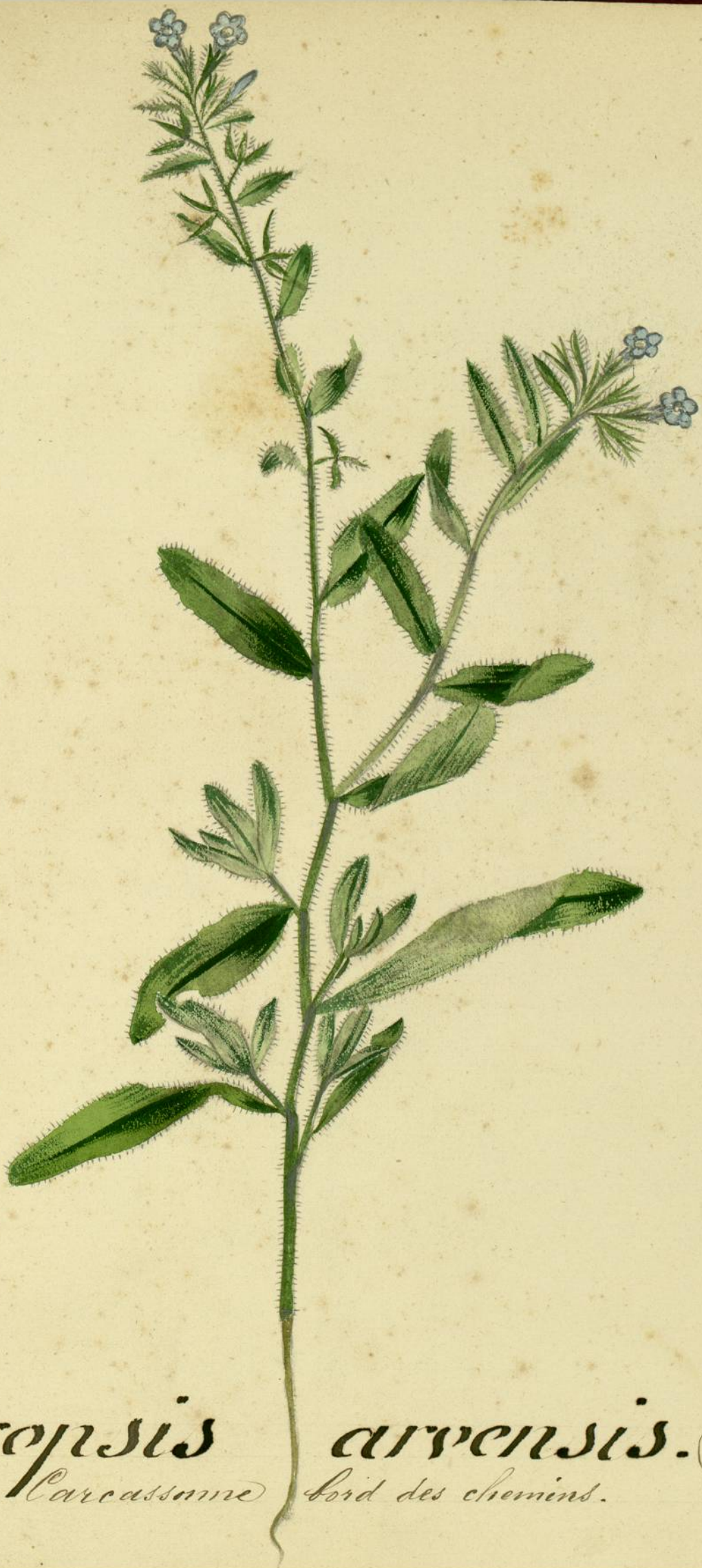
Lyceopsis arvensis. (Linné.) Carcassonne bord des chemins.