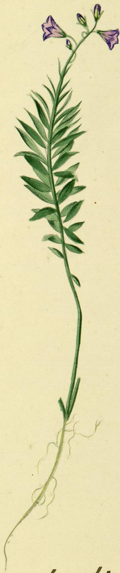
Campanula linifolia. (Lamarck.) Escouboube.