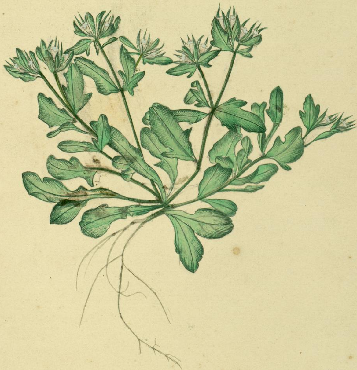
Valerianella carinata. (Eiselen.) Carcassonne, pelouses.