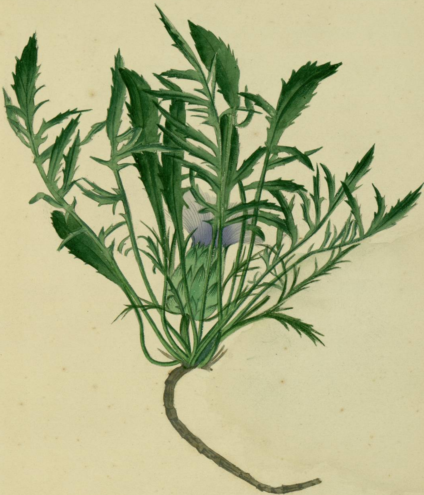
Carduncellus mitissimus. De Candolle. Coteaux aux environs de Carcassonne.