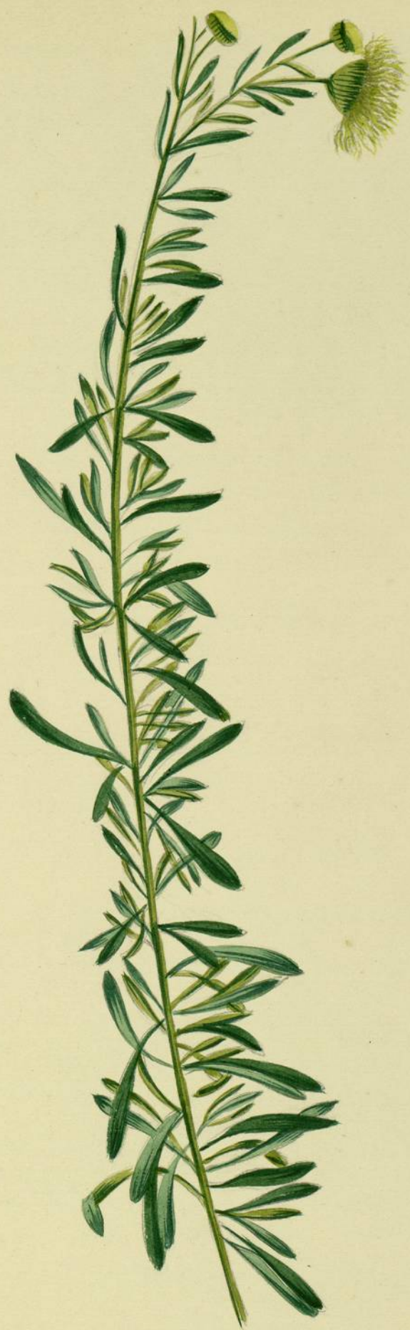
Inula crithmoides. (Linné.) Ile de Sainte.