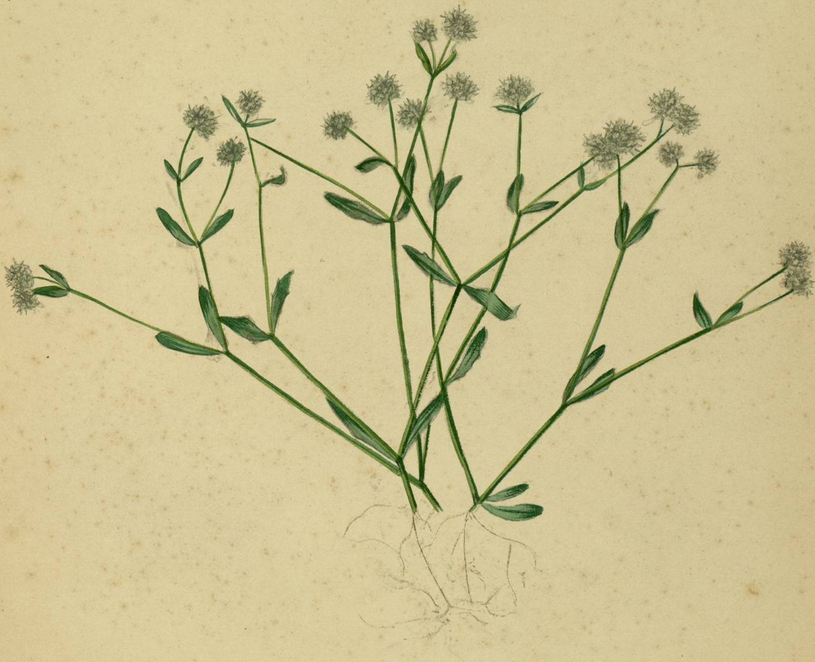
Valerianella oliteria. (Pollich.) Carcassonne, pelouses.