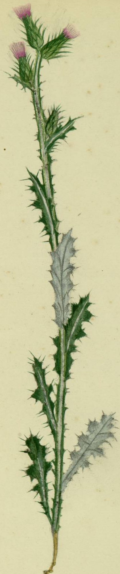
Carduus crispus. (Linné.) Carcassonne, bord des chemins.