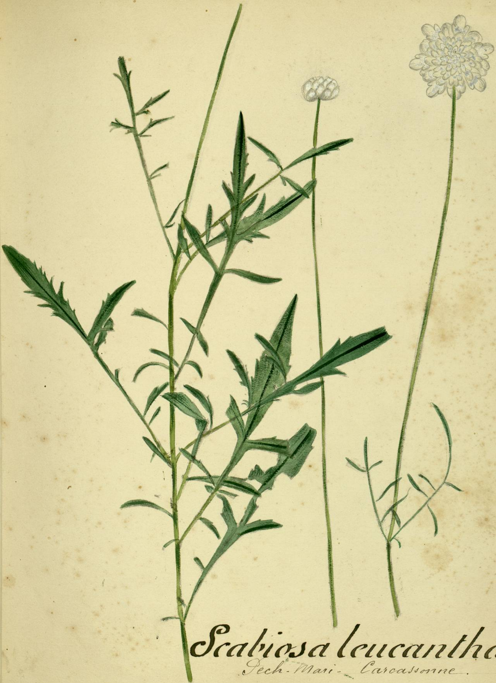
Scabiosa leucantha. (Linné) Tsch. Mai - Carcassonne.