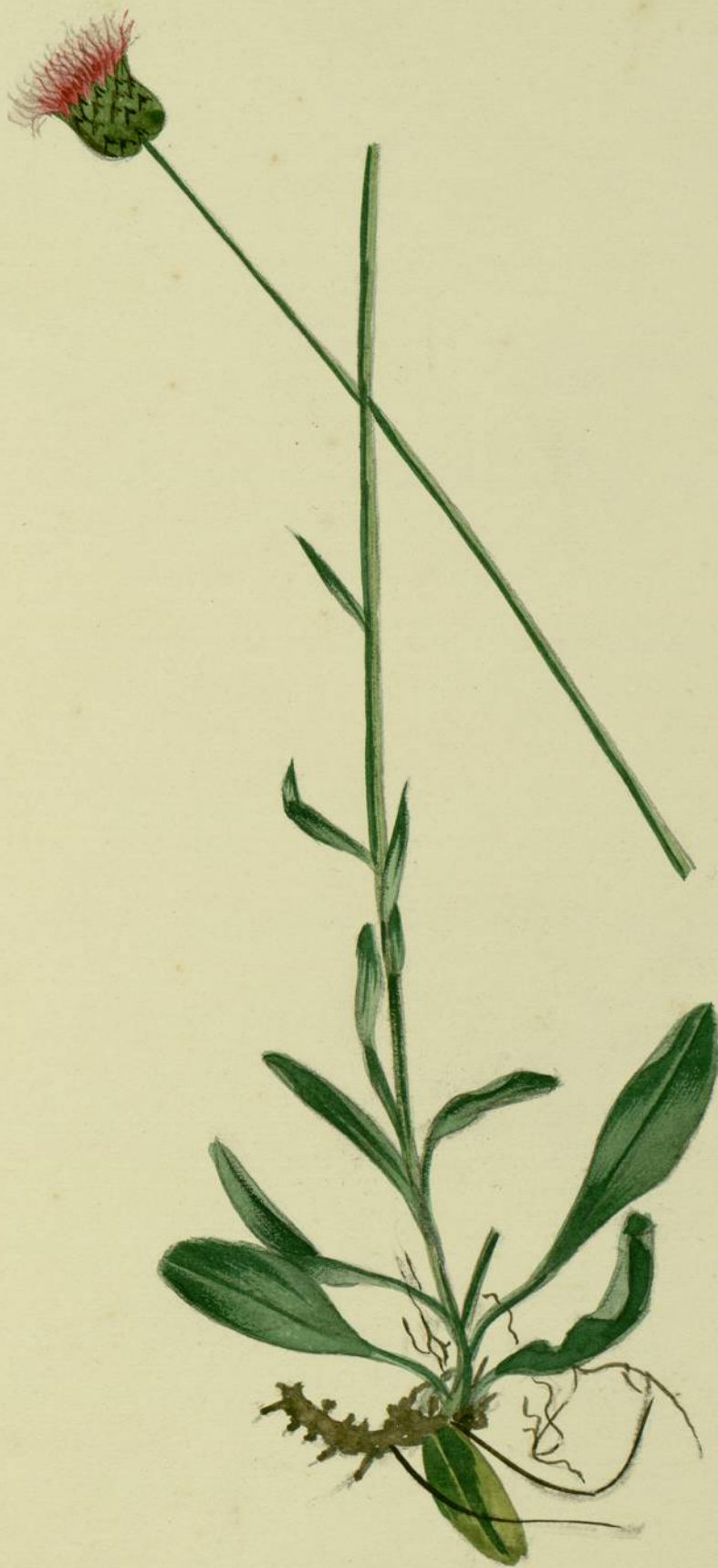
Serratula nudicaulis. (De Candolle.) Alarie.