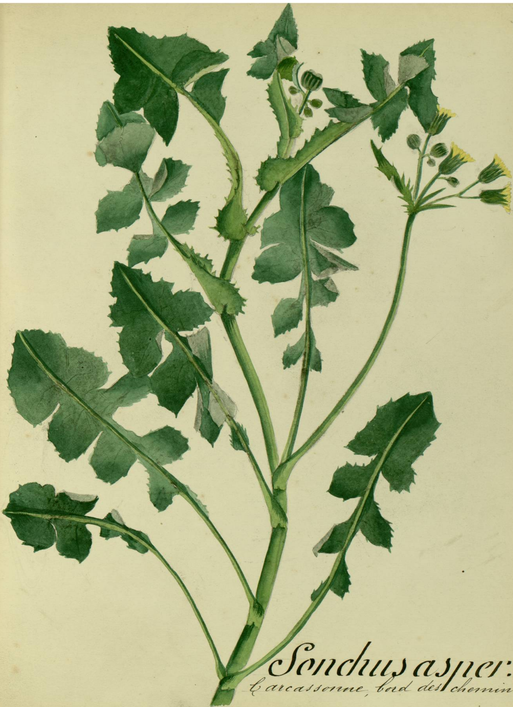
Sonchus asper : (Villars) Carcassonne, bord des chemins.