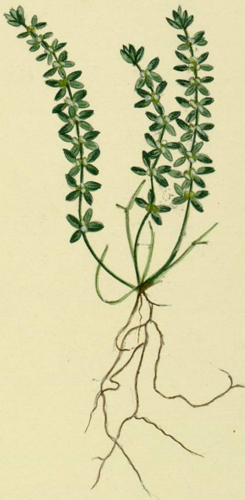
Vaillantia muralis. (Linné.) La Clape.