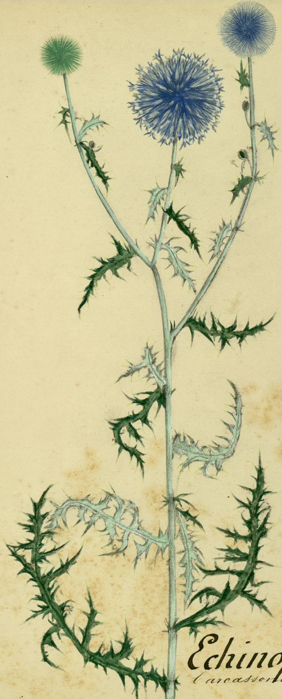
Echinops Ritro (Linné) Carcassonne, bord des chemins.