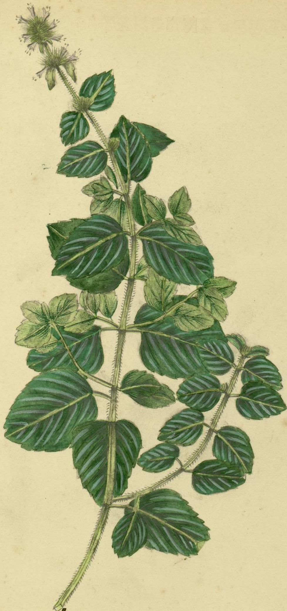
Mentha aquatica. (Linné.) Carcassonne, endroits humides.