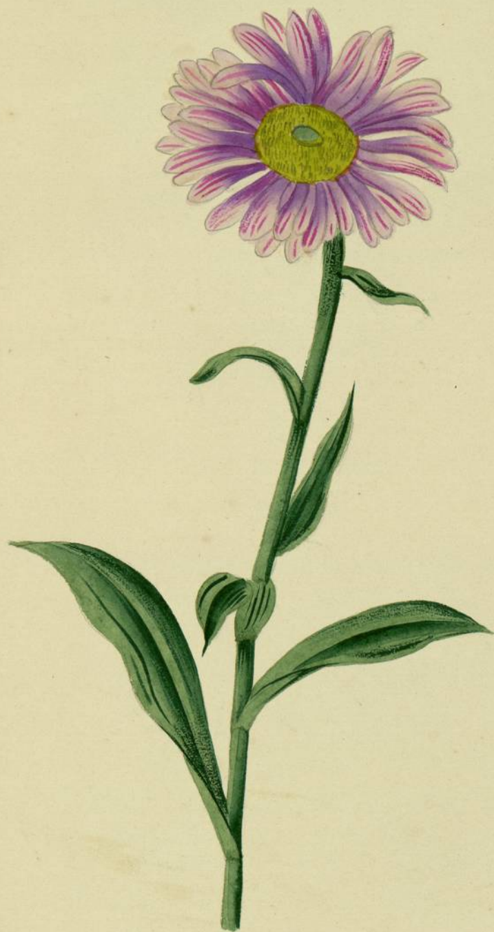
Aster alpinus. (Linné.) Bugarach.