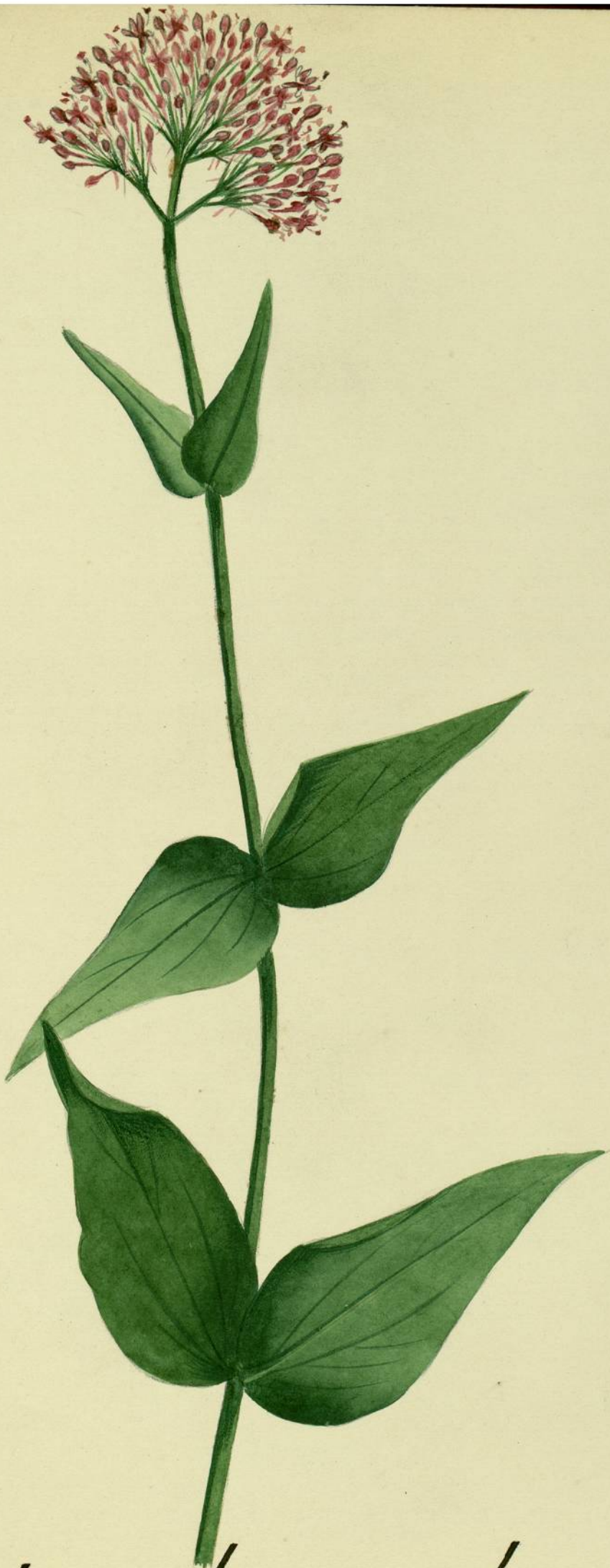
Centranthus ruber. (De Candolle.) Carcassonne, murs, rochers.