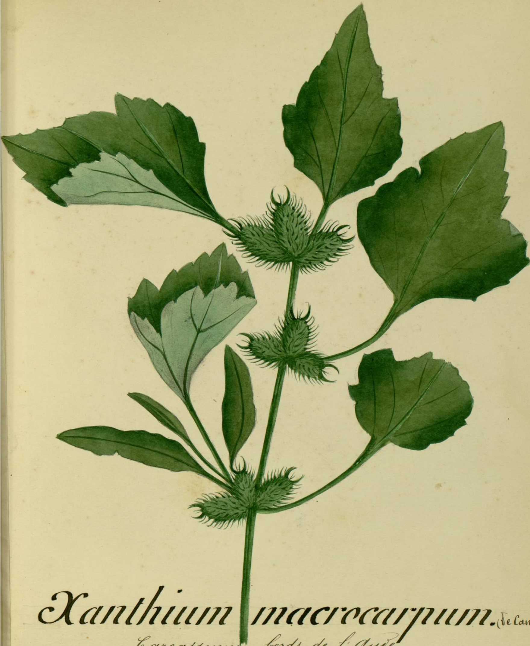
Xanthium macracarpum. (De Candolle.) Carcassonne, bords de l'Aude.