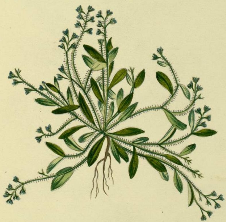
Myosotis hispida. (Schlecht.) Carcassonne, endroits incultes.