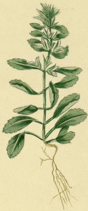
Sideritis remana. (Linné.) Montagne-Noire.