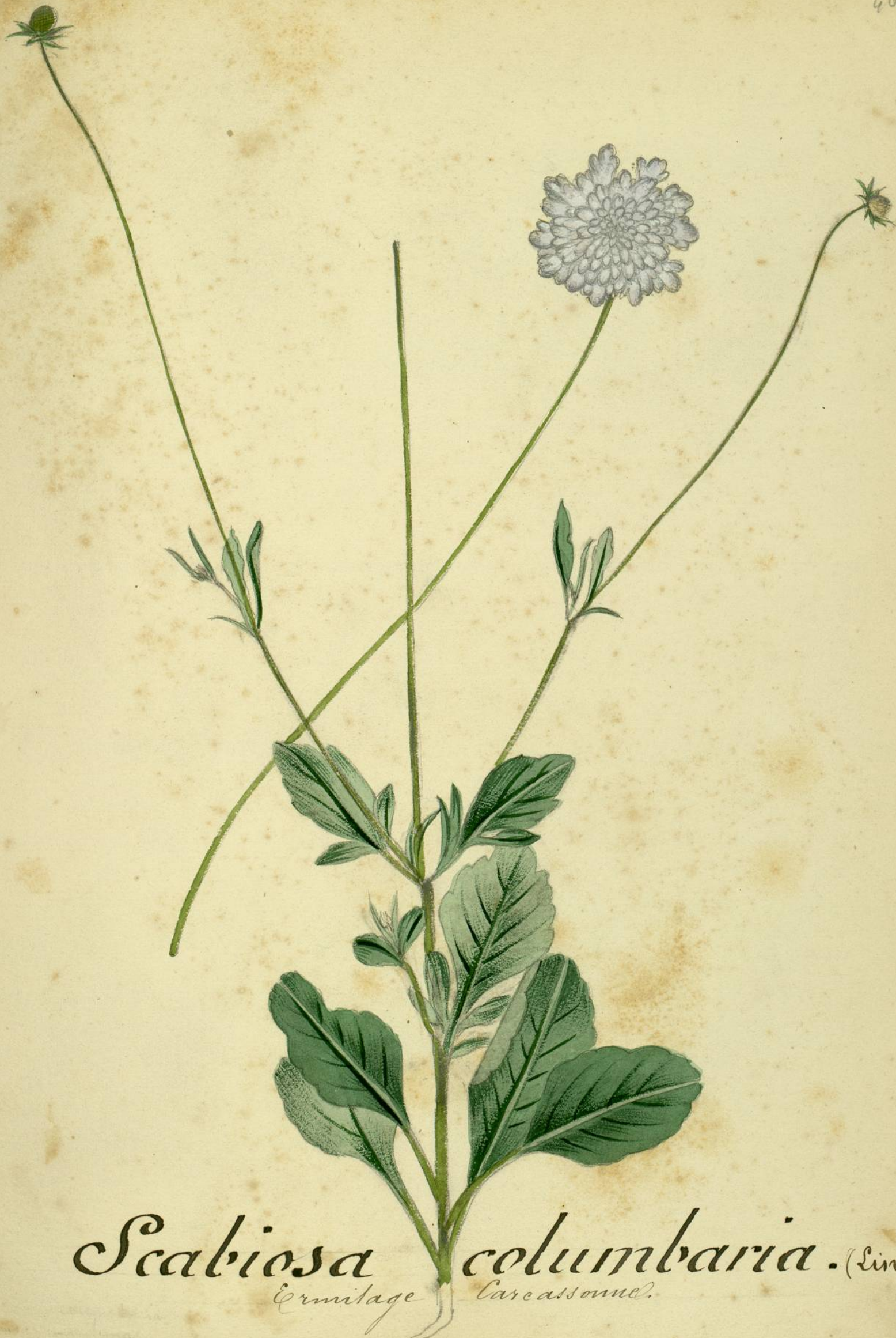
Scabiosa columbaria. (Linné.) Ermitage Carcassonne.