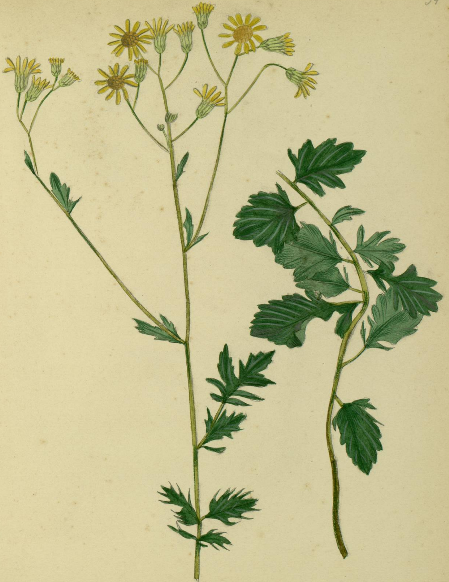
Senecio Jacobaea. (Linné.) Fris, Carcastonne.