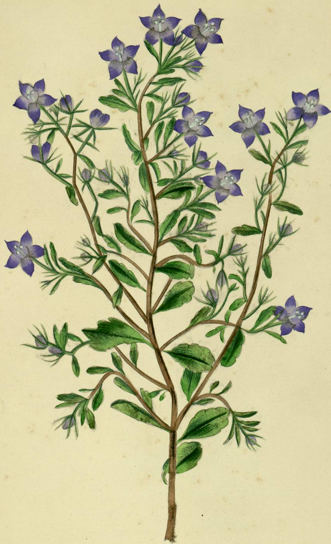
Specularia Speculum. (Alph. de Candolle.) Champs, Carcassonne.