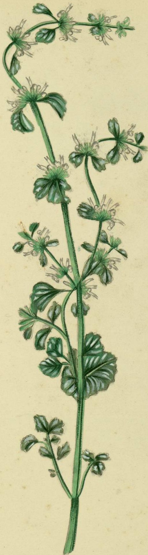
Marrubium vulgare. (Linné) Carcassonne.