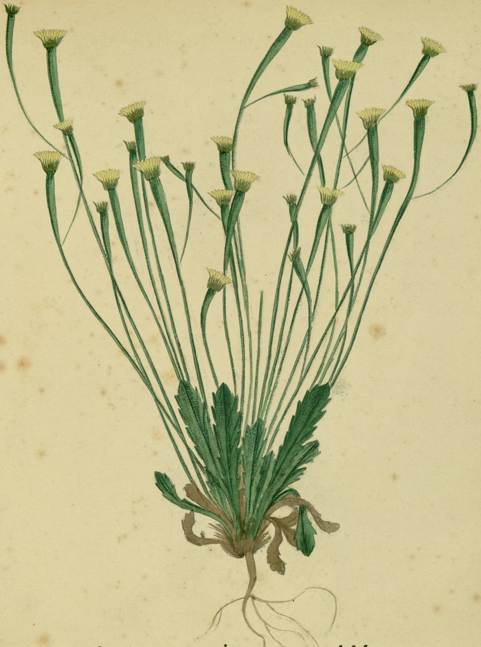
Arnoseris pusilla. (Goertner.) Montagne Noire.