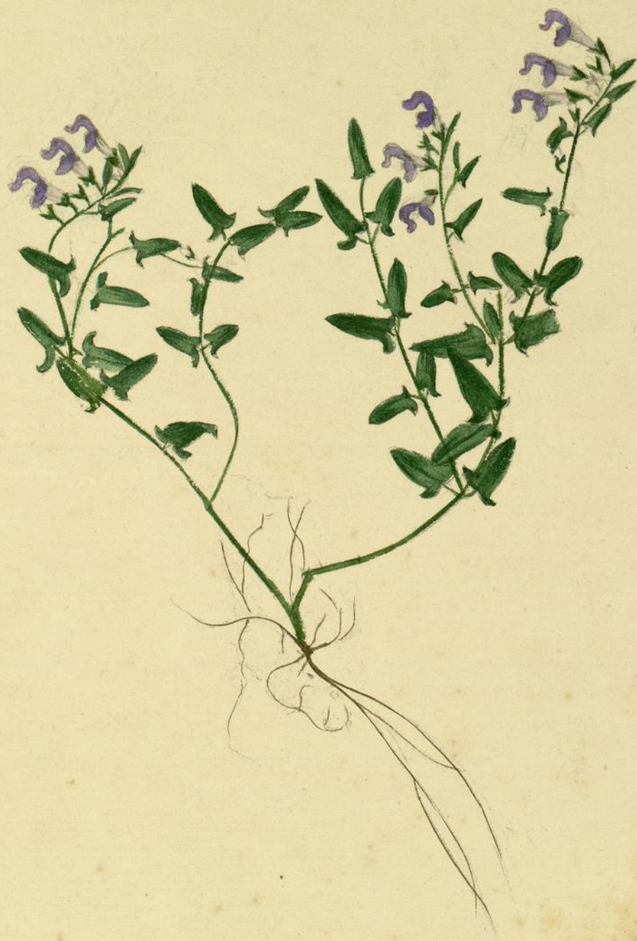
Scutellaria hastifolia. (Linné.) Gindes, bord du ruisseau.