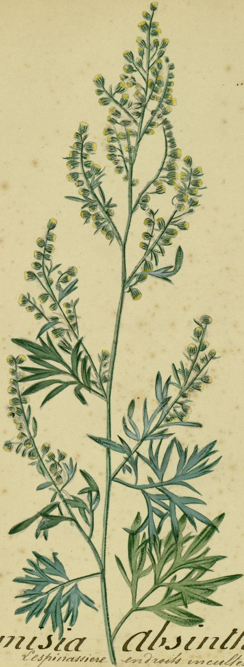
Artemisia absinthium. (Linné.) Lespinassiere endroits incultes.