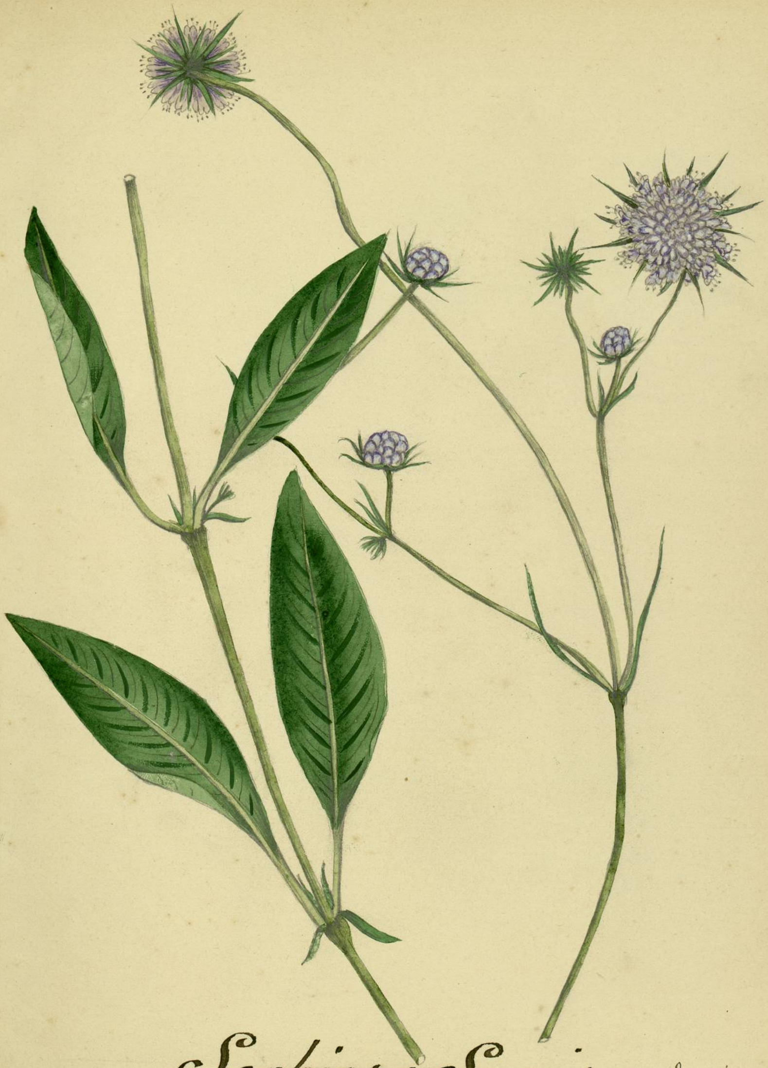
Scabiosa Succisa. (Linné.) Carcassonne, rue droite de l'Aude, Chaussée-Neuve.