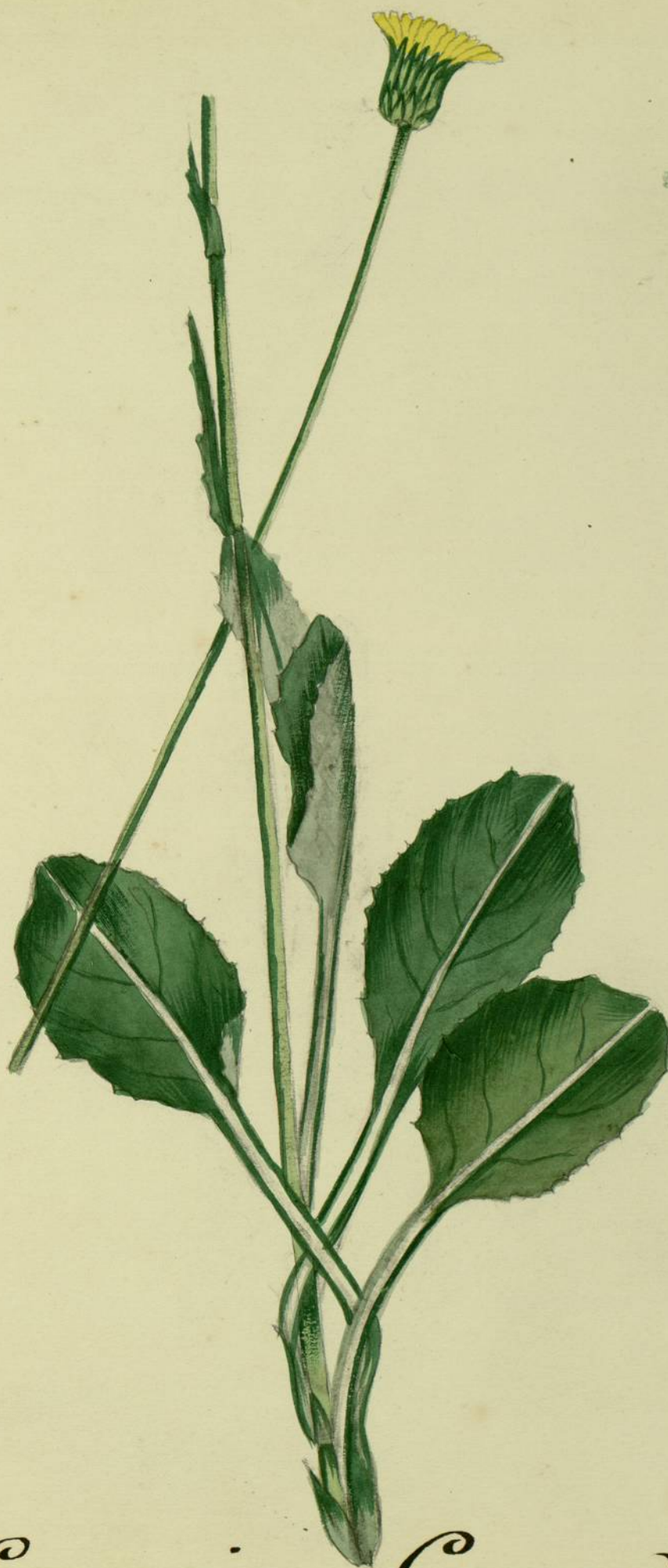
Senecio Gerardi. (Grenier et Godron.) alpic