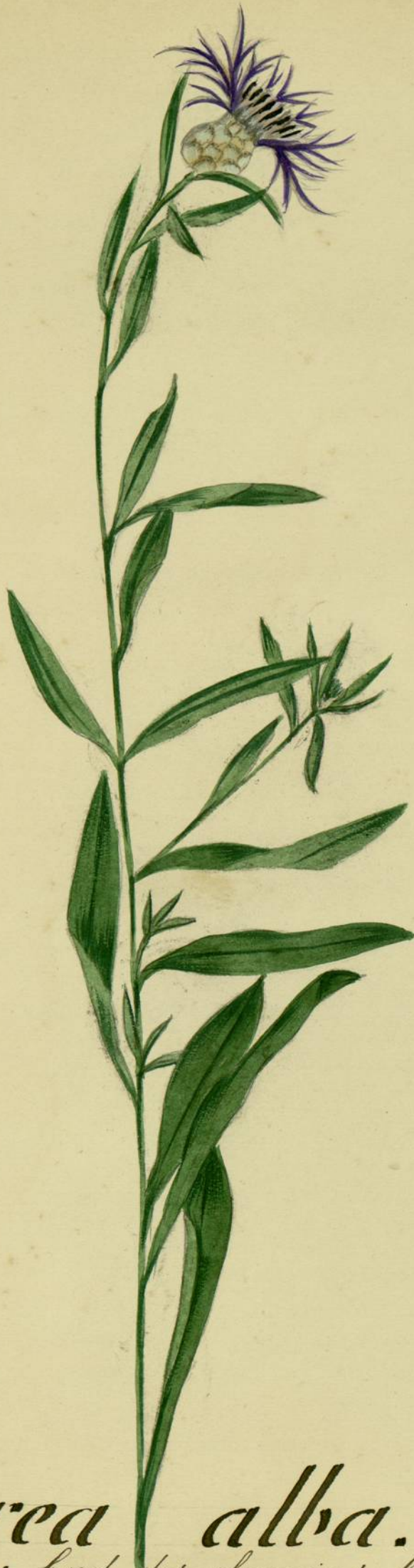
Centaurea alba. (Loiseleur.) Montolieu, bord des chemins, lieux secs.