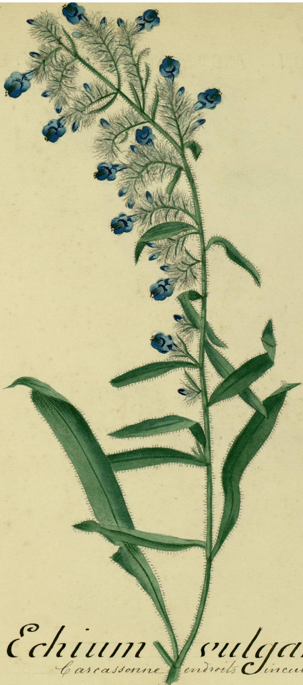
Echium vulgare. (Linné.) Carcassonne endroits incultes.