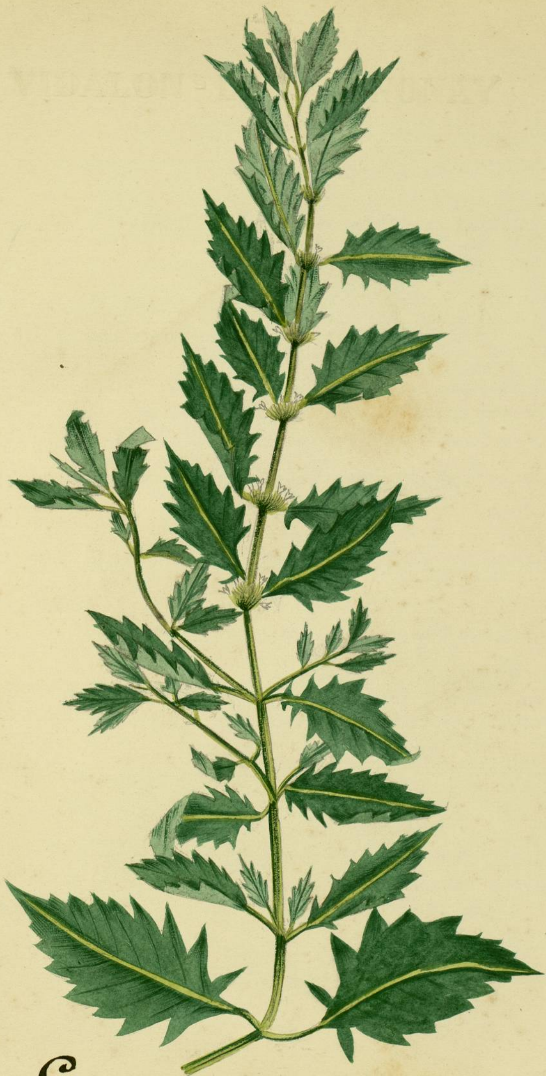
Lycoopus europaeus. (Linné.) Bords de l. Aude, Montplaisir,