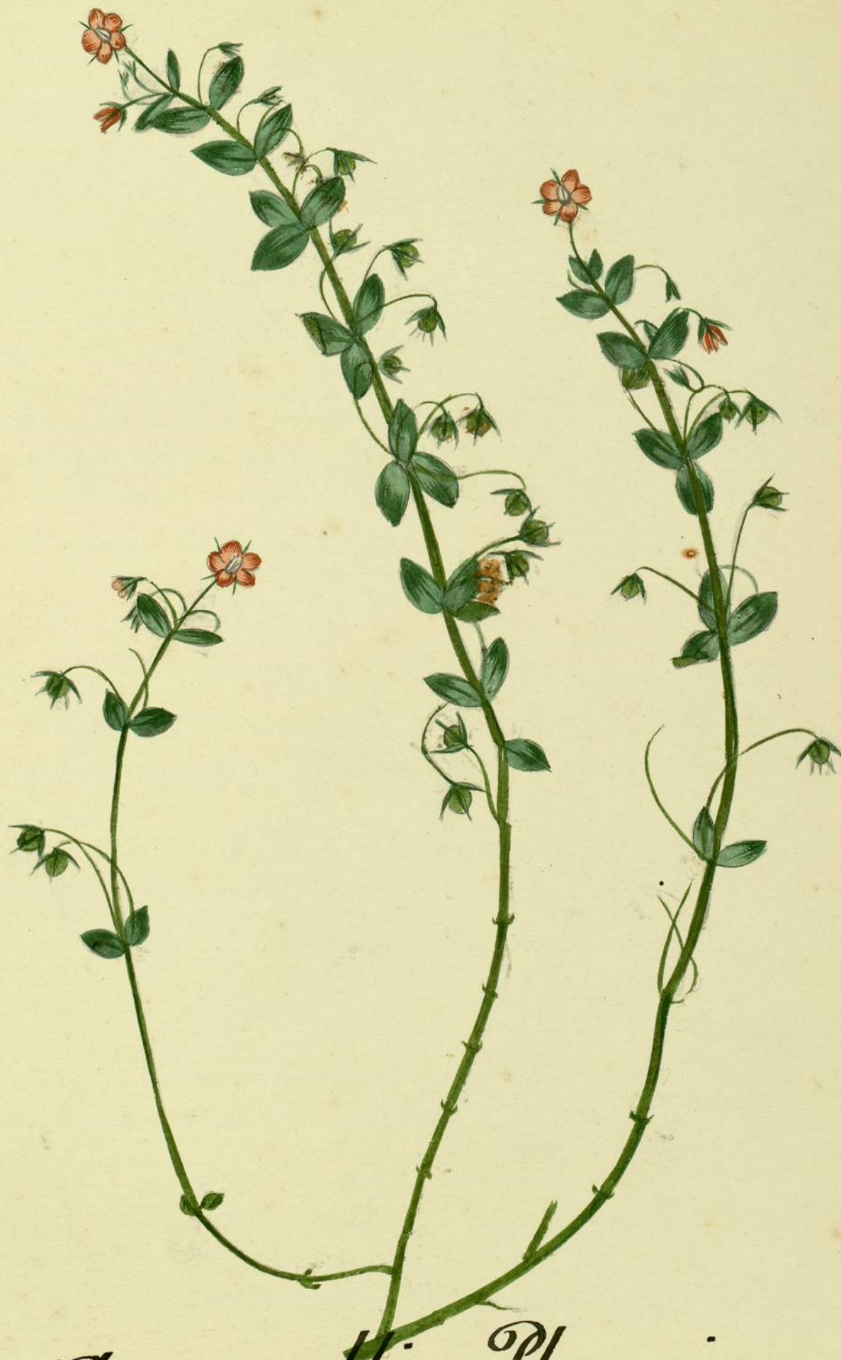
Anagallis Thænicea. (Lamarck.)