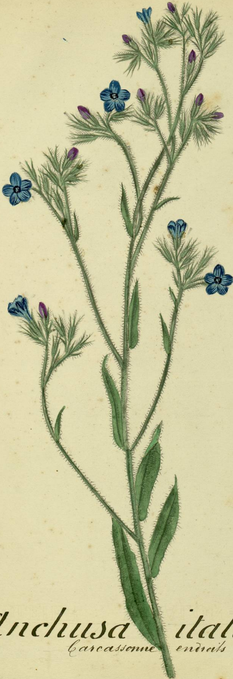
Anchusa italica. (Linné.) Carcassonne endroits incultes.