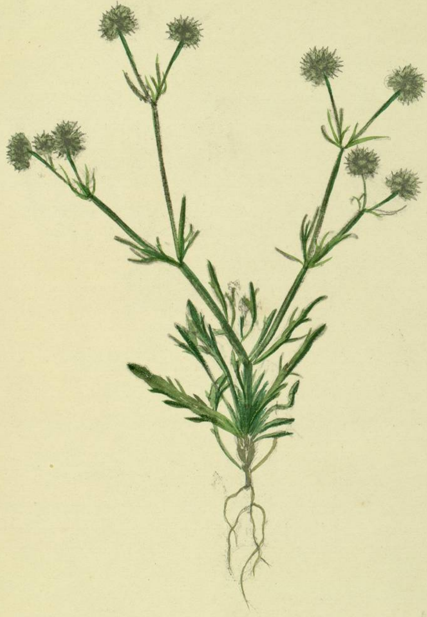
Valerianella discoidea. (Loidem.) Carcassonne, pelouses.