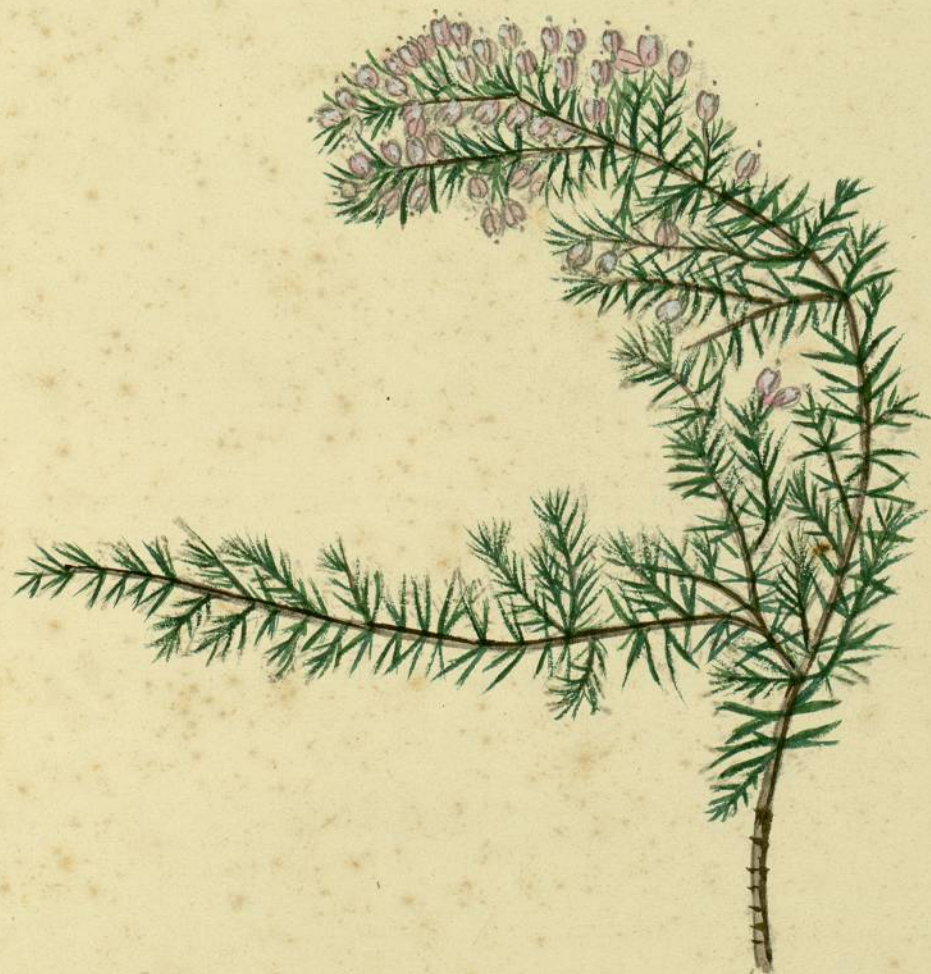
Erica arborea. (Linné.) Malespère.