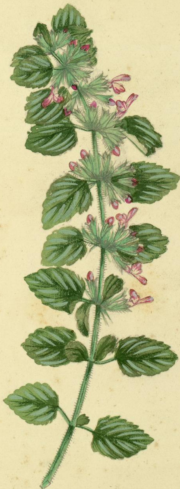
Ballota foetida. (Lamarck.) Carcassonne, bord des chemies.