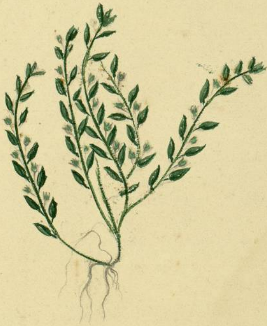
Centunculus minimus. (Linné.) Montolieu.