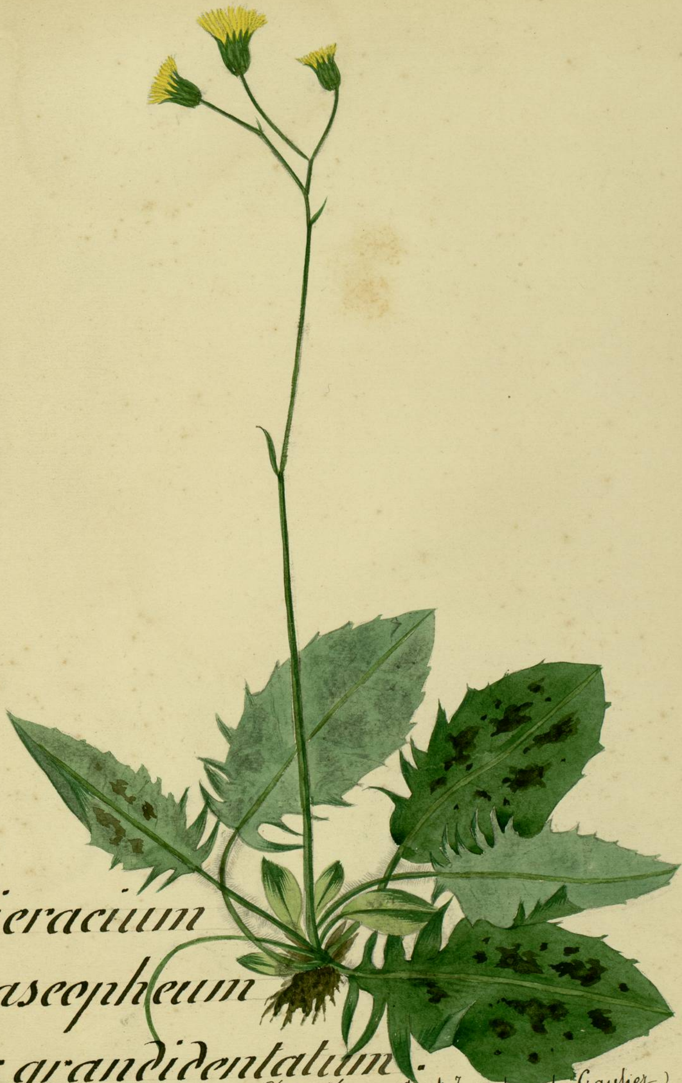
Hieracium praeaeophyllum var. grandidentatum . Madame au Chapite. (Arvet-Gouvet et Gauthier.)