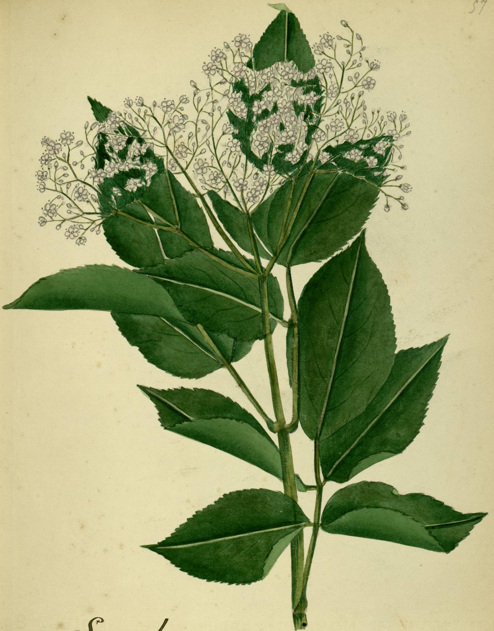
Sambucus nigra. (Linne.) Carcassonne haies.