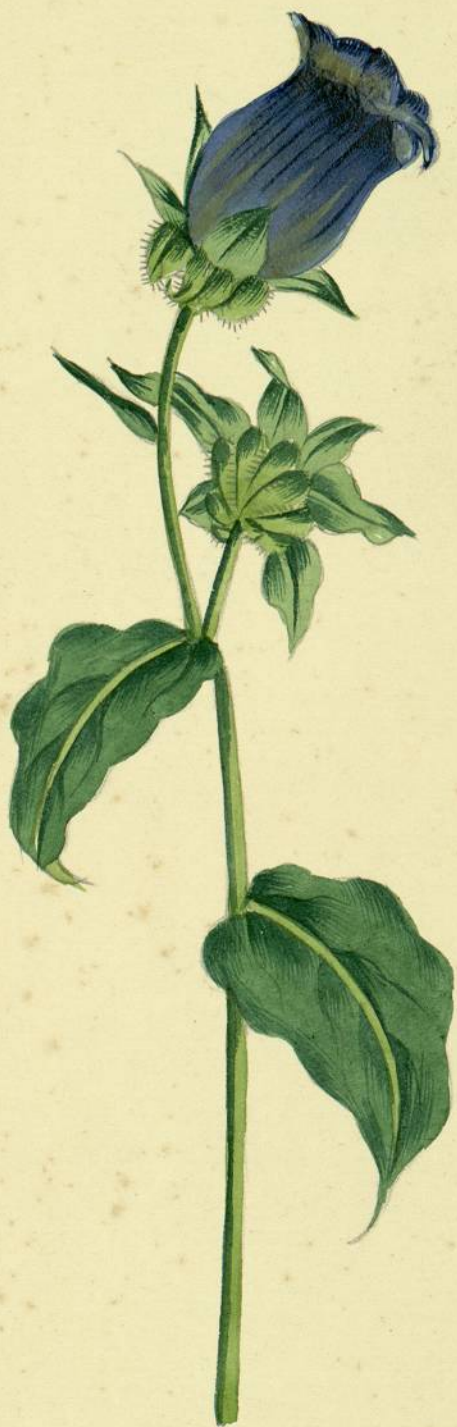
Campanula medium. (Linné.) Cuxac - Cabardès.