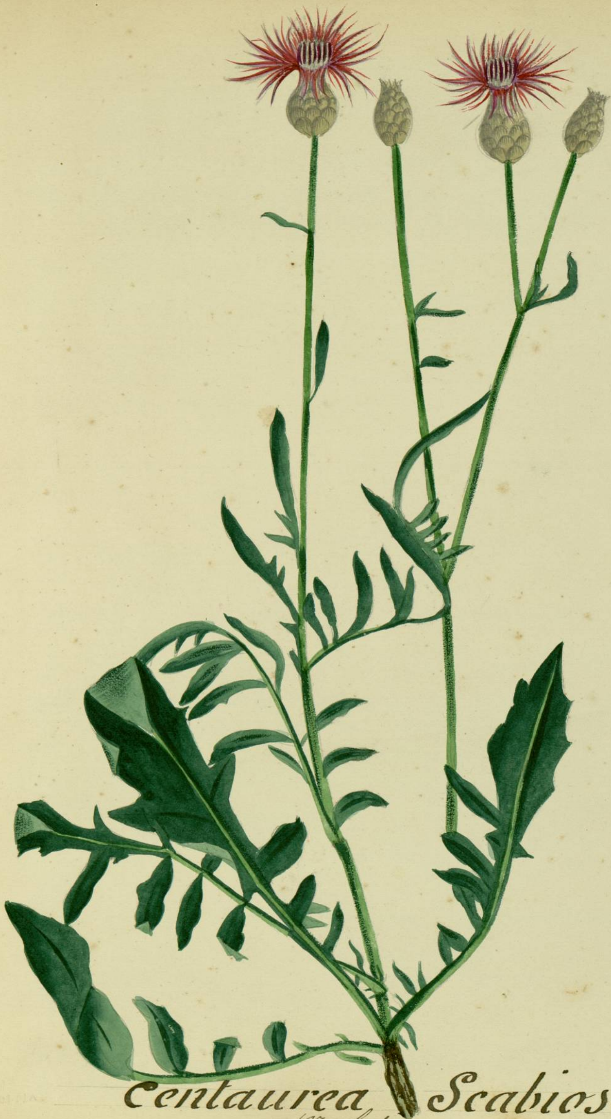
Centaurea Scabiosa. (Linné.) 176 a lespere.