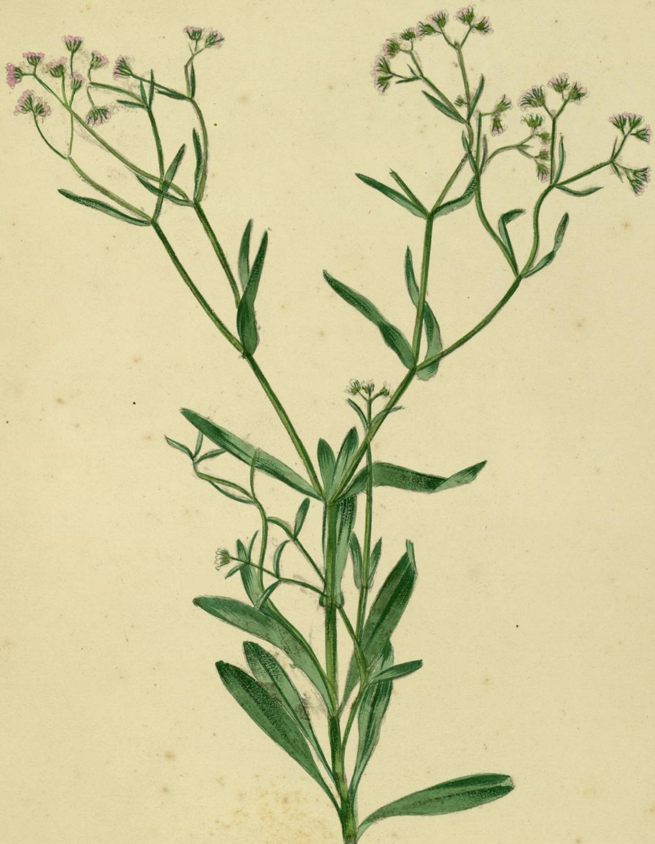
Valerianella auricula. (De Candolle.) Carcassonne, pelouses.

V. auricula racine lisse, fleurs roses sur le bord des pelouses