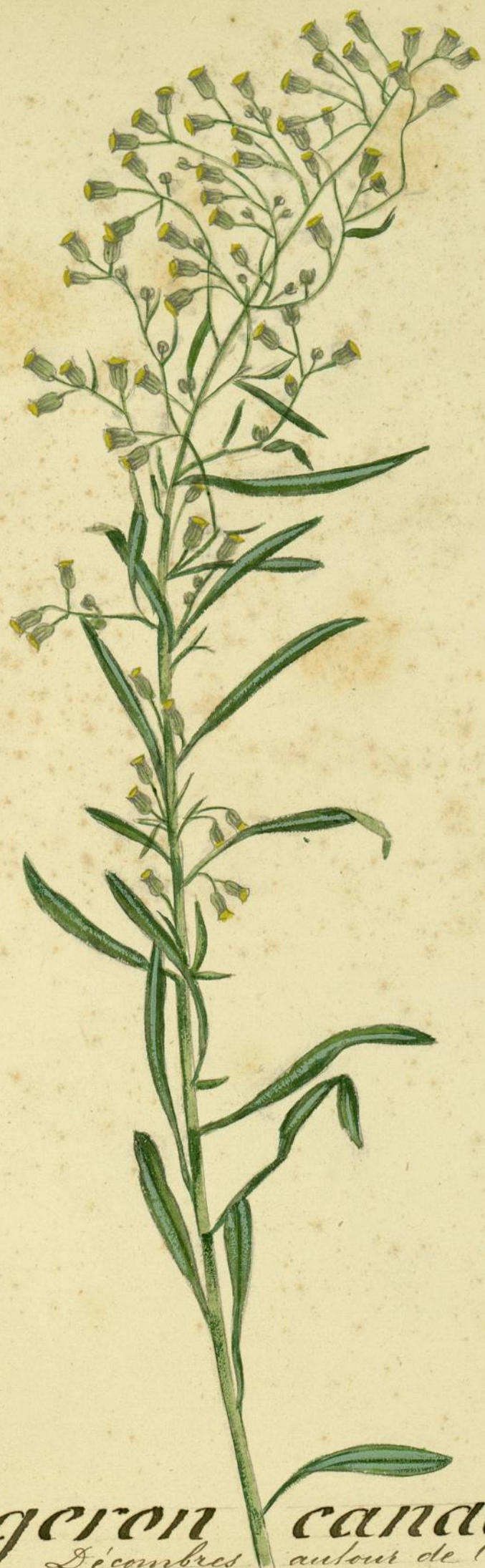
Erigeron canadensis. (Linné.) D'ombres autour de Carcassonne.