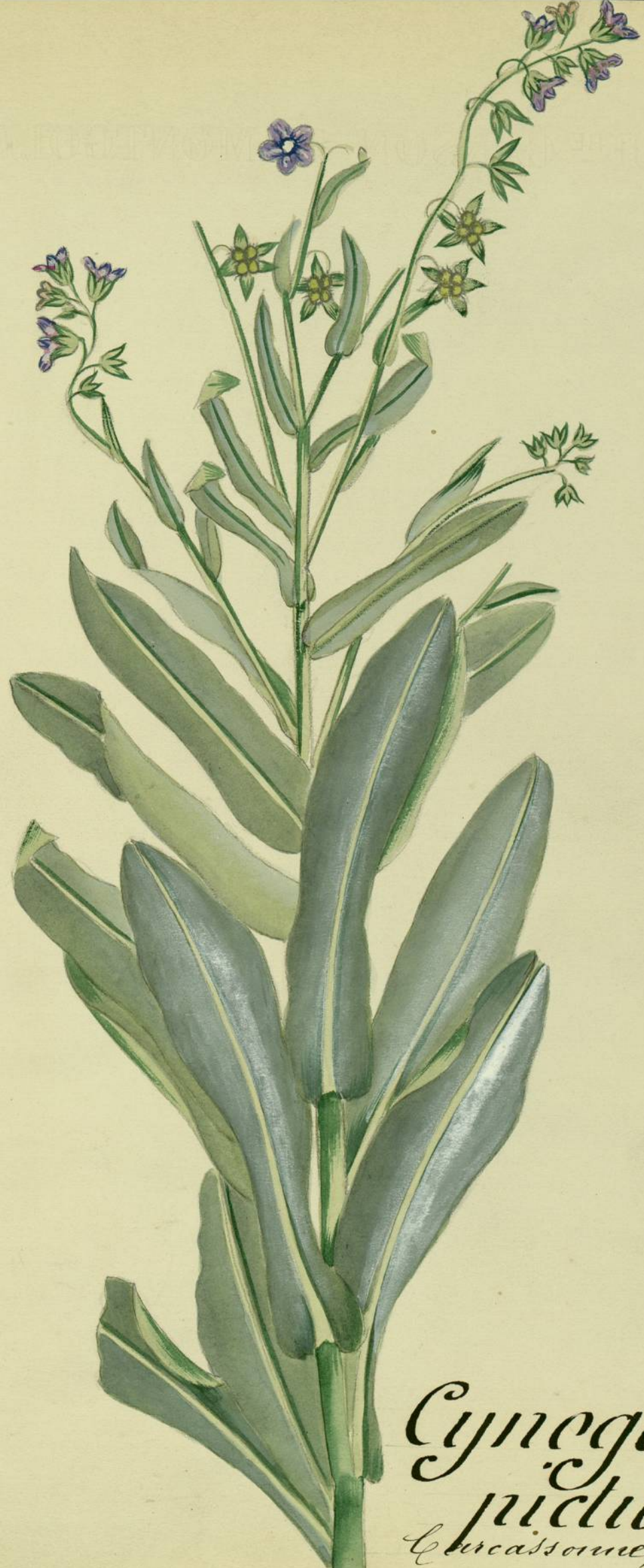
Cynoglossum pictum. (Aiton.) Caucasus, endroits incultes.