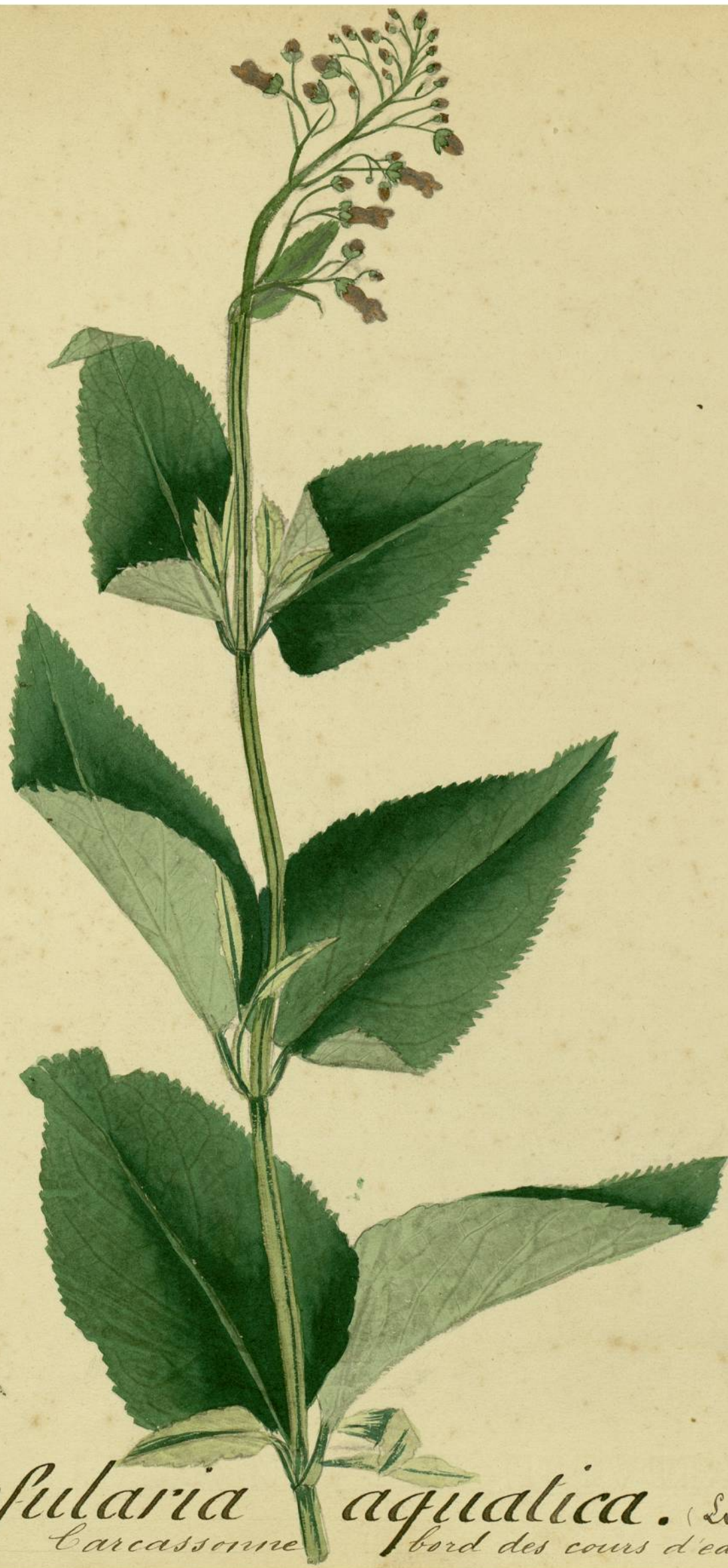
Scrophularia aquatica. (Linné) Carcassonne bord des cours d'eau.