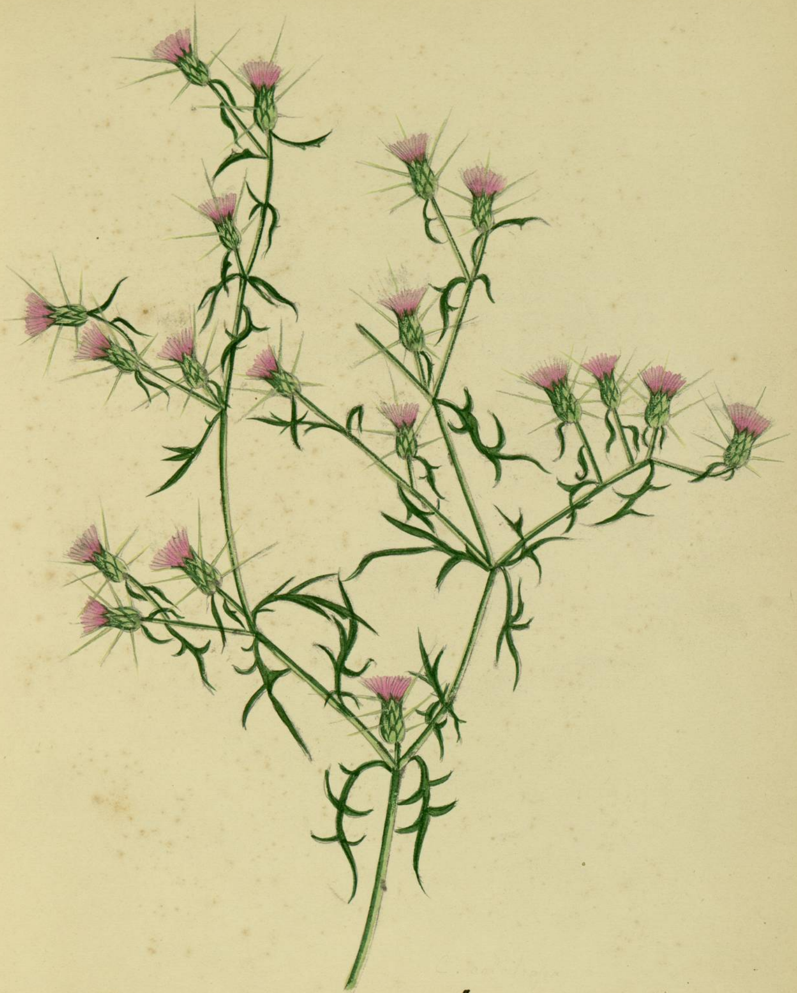
Centaurea calcitrapa. (Linné.) Carcassonne, endroits incultes.