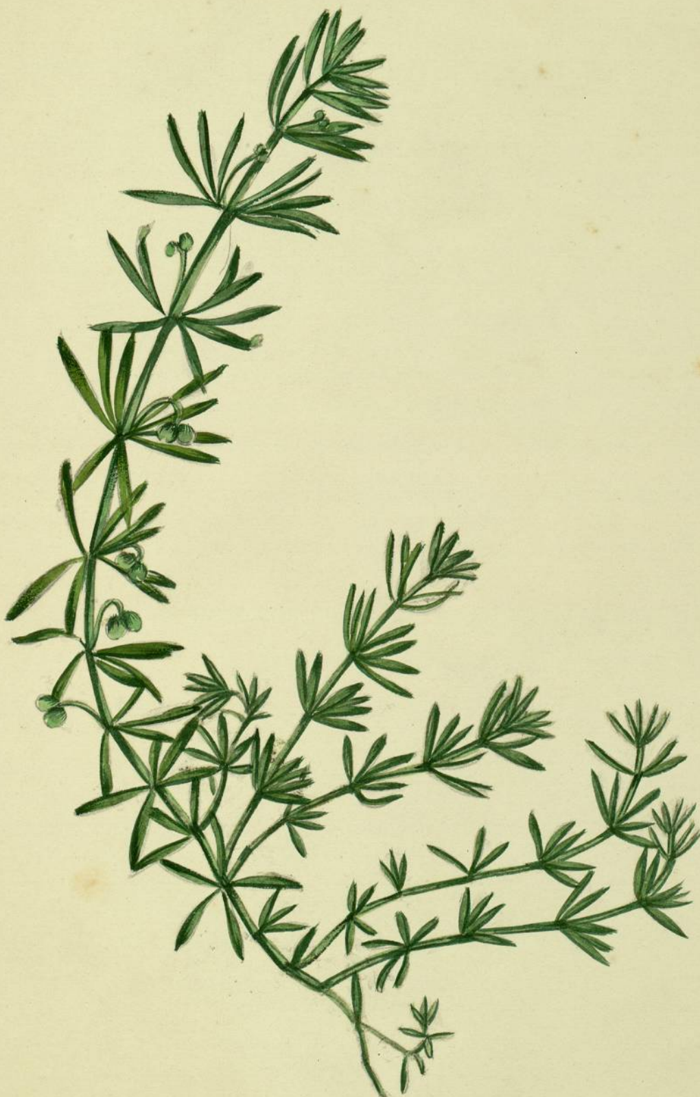
Galium tricorne. (Withering.) Carcassonne, haies.