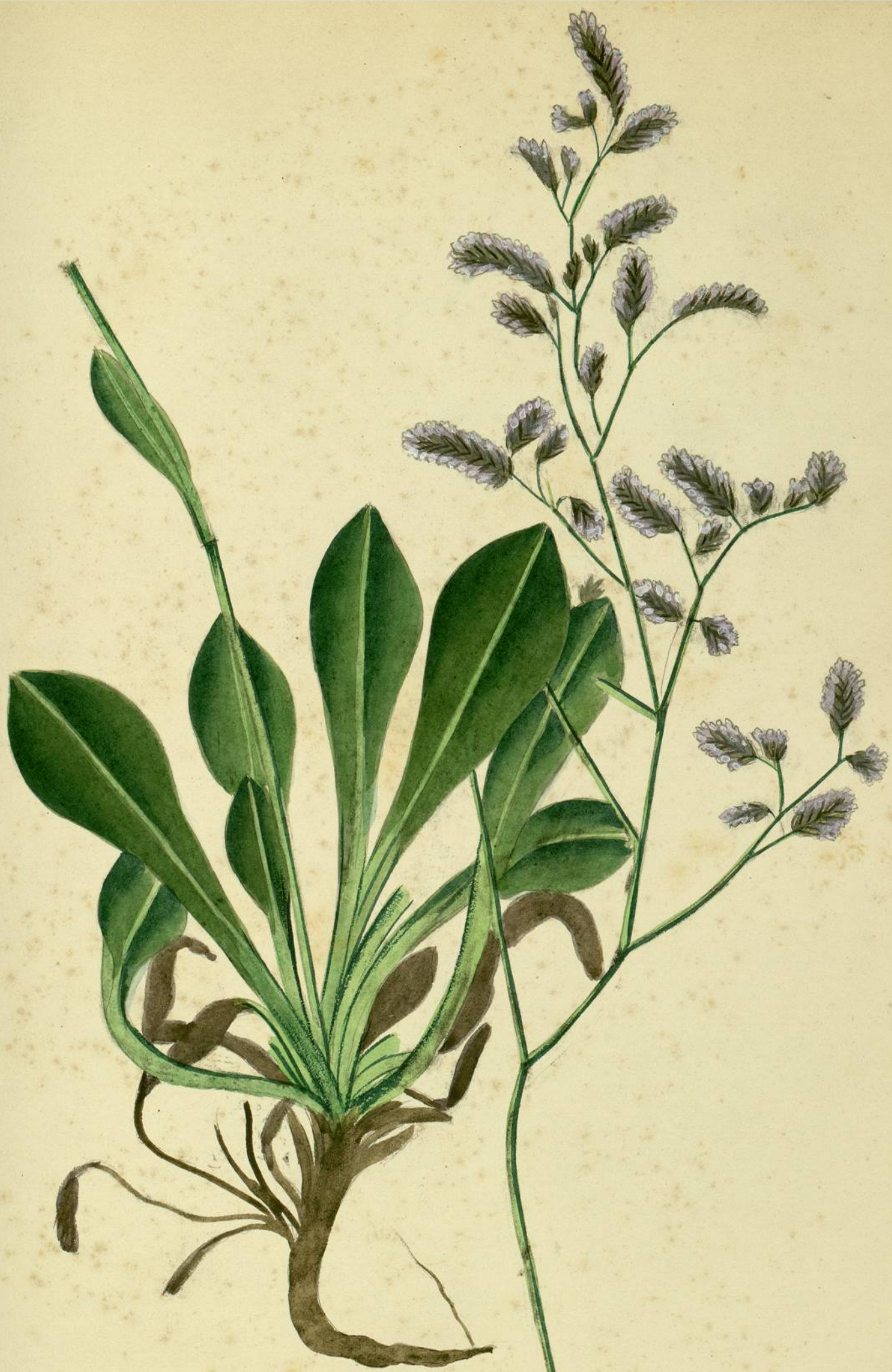
Statice lychnidifolia . (Girard) Ile de Laute.