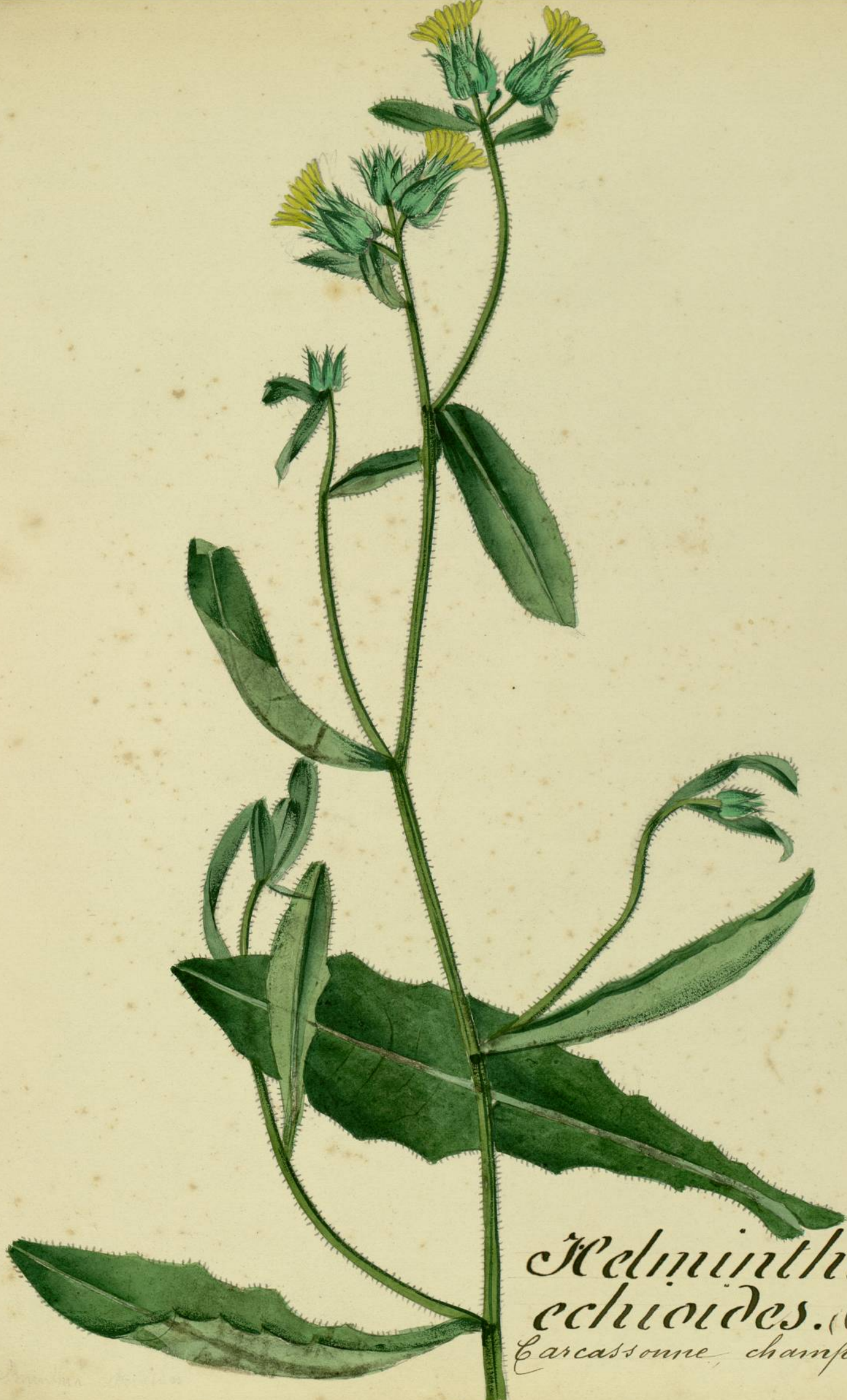
Melminthia echioides. (Gartner) Carcassonne, champs.