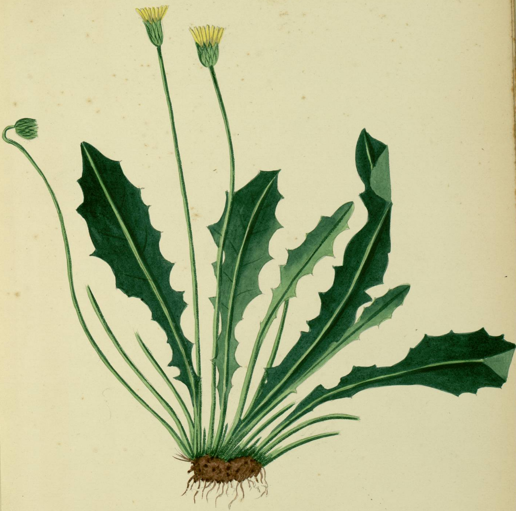
Leontodon proteiformis. (Willars.) Montolieu.