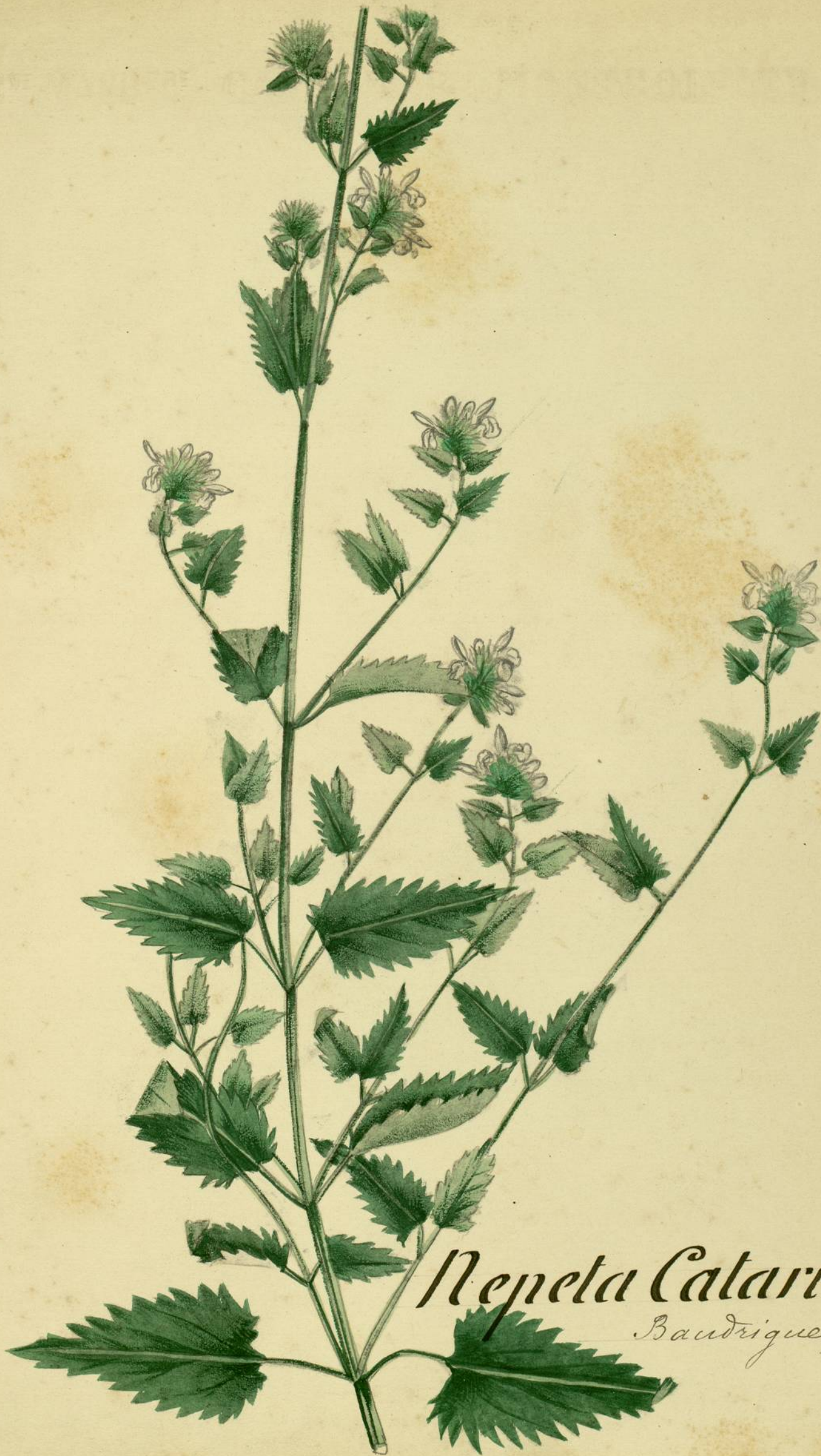
Nepeta Cataria. (Linné.) Baudrigues.