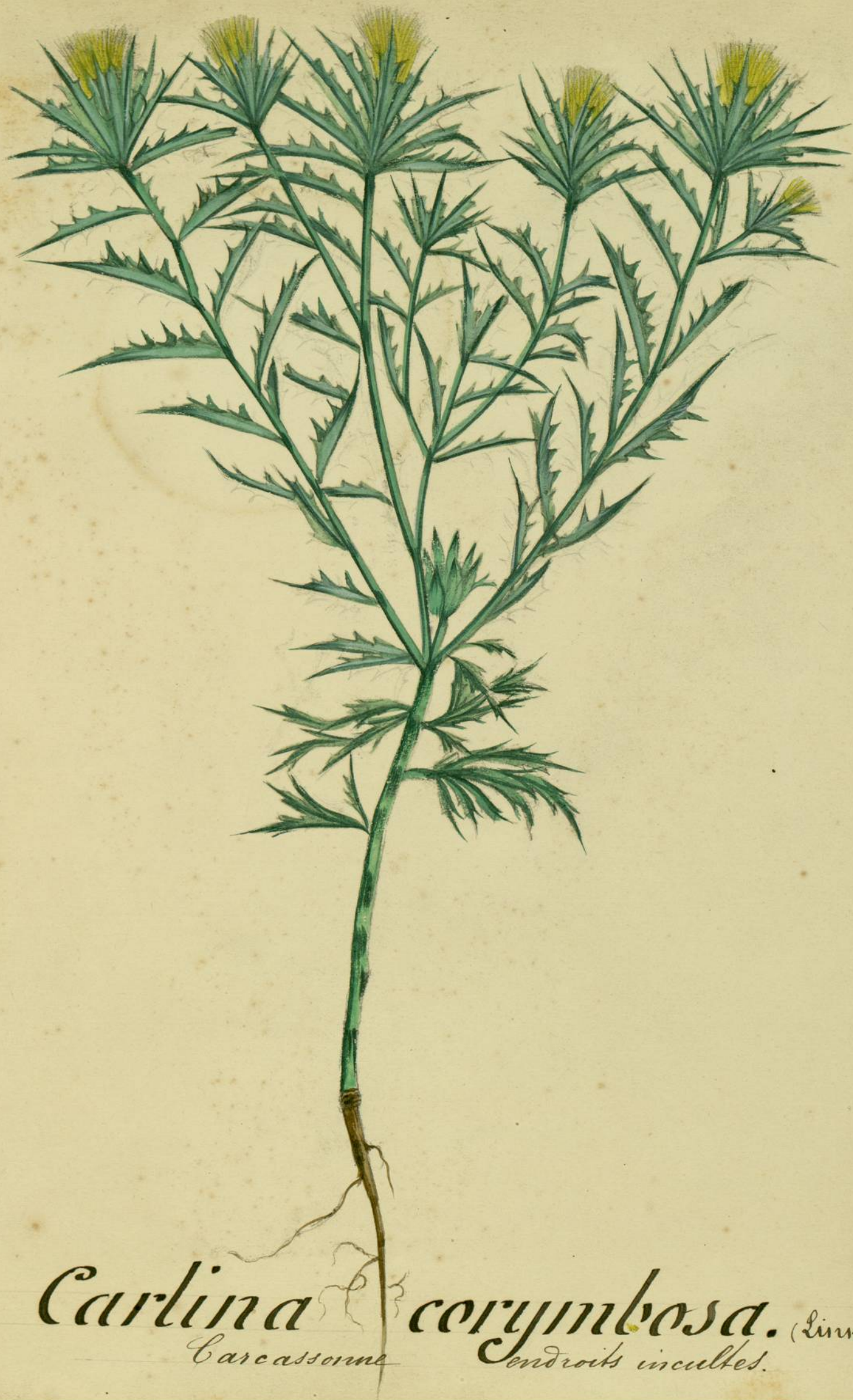
9 Carlina corymbosa. (Linné.) Carcassonne endroits incultes.