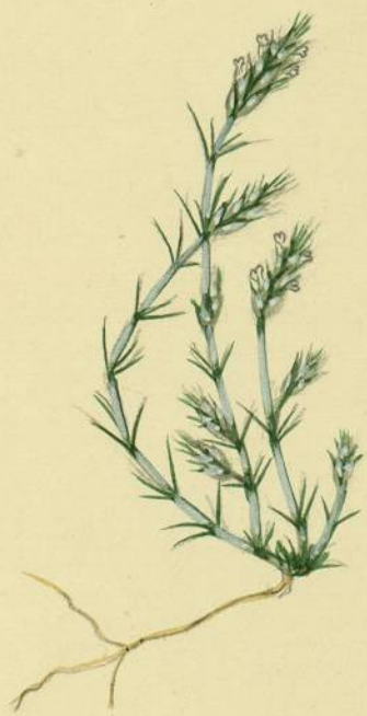
Crucianella maritima. (Linné.) La Clape.