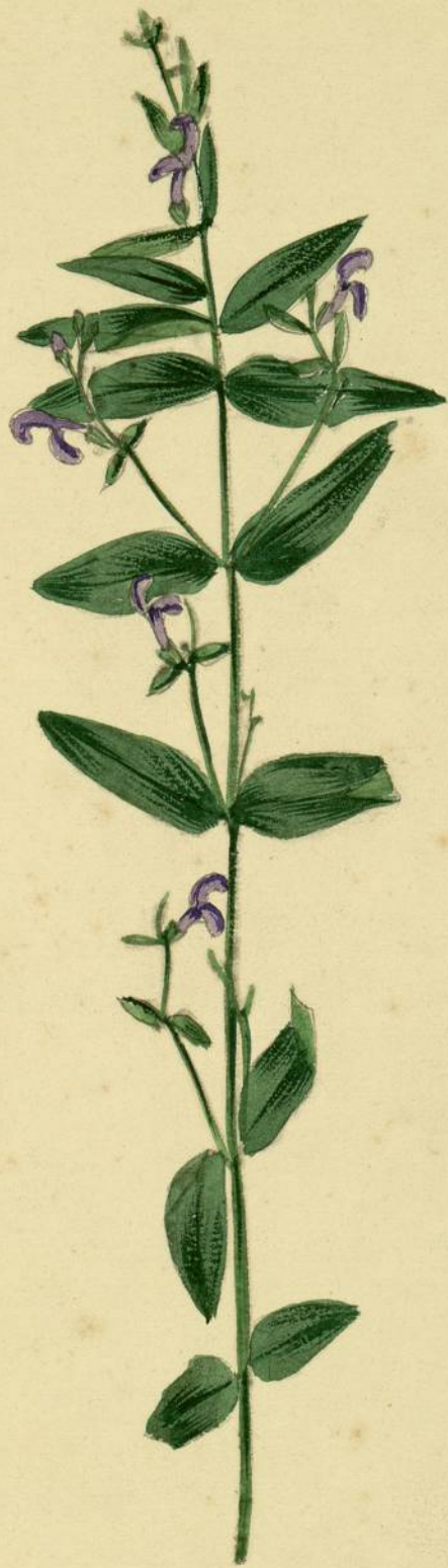
Scutellaria minor. (Linné) Les Martyrs.