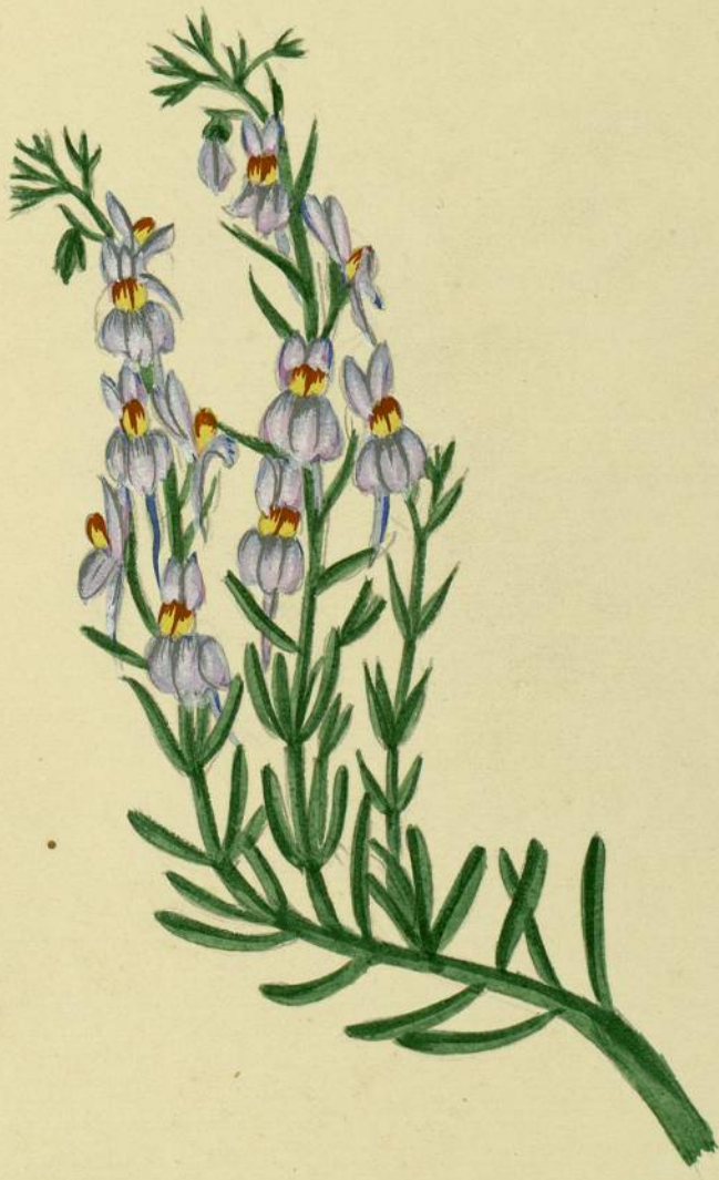
Sinaria alpina. (De Candolle.) Pic de Noce.