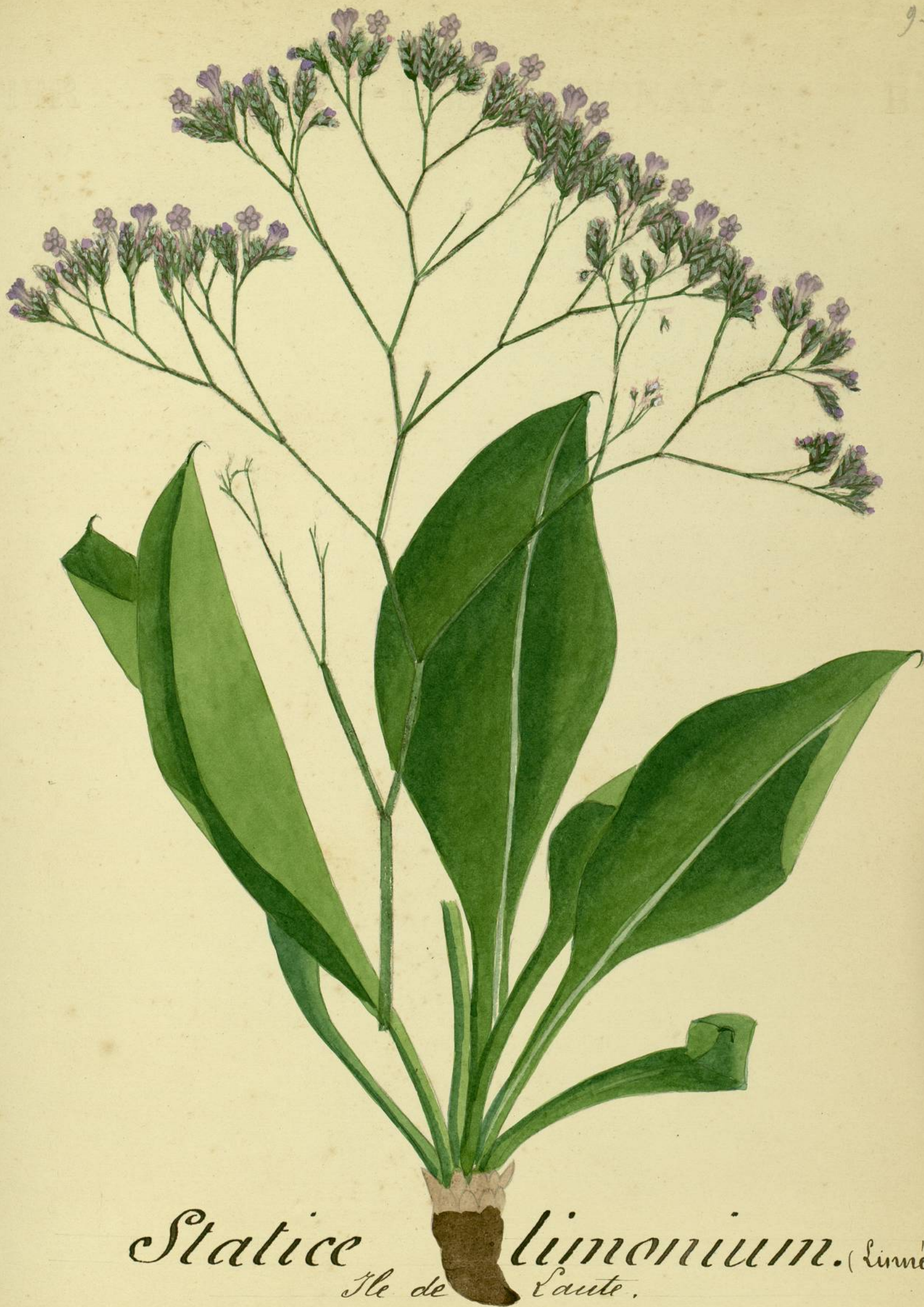
Statice limonium. (Linné) Ile de Lante.