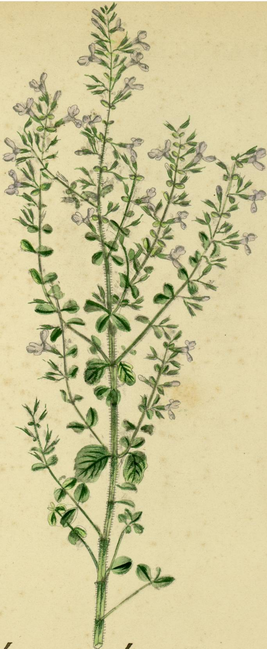
Calamintha Nepeta. (Clairville.) Endroits secs, Carcassonne.