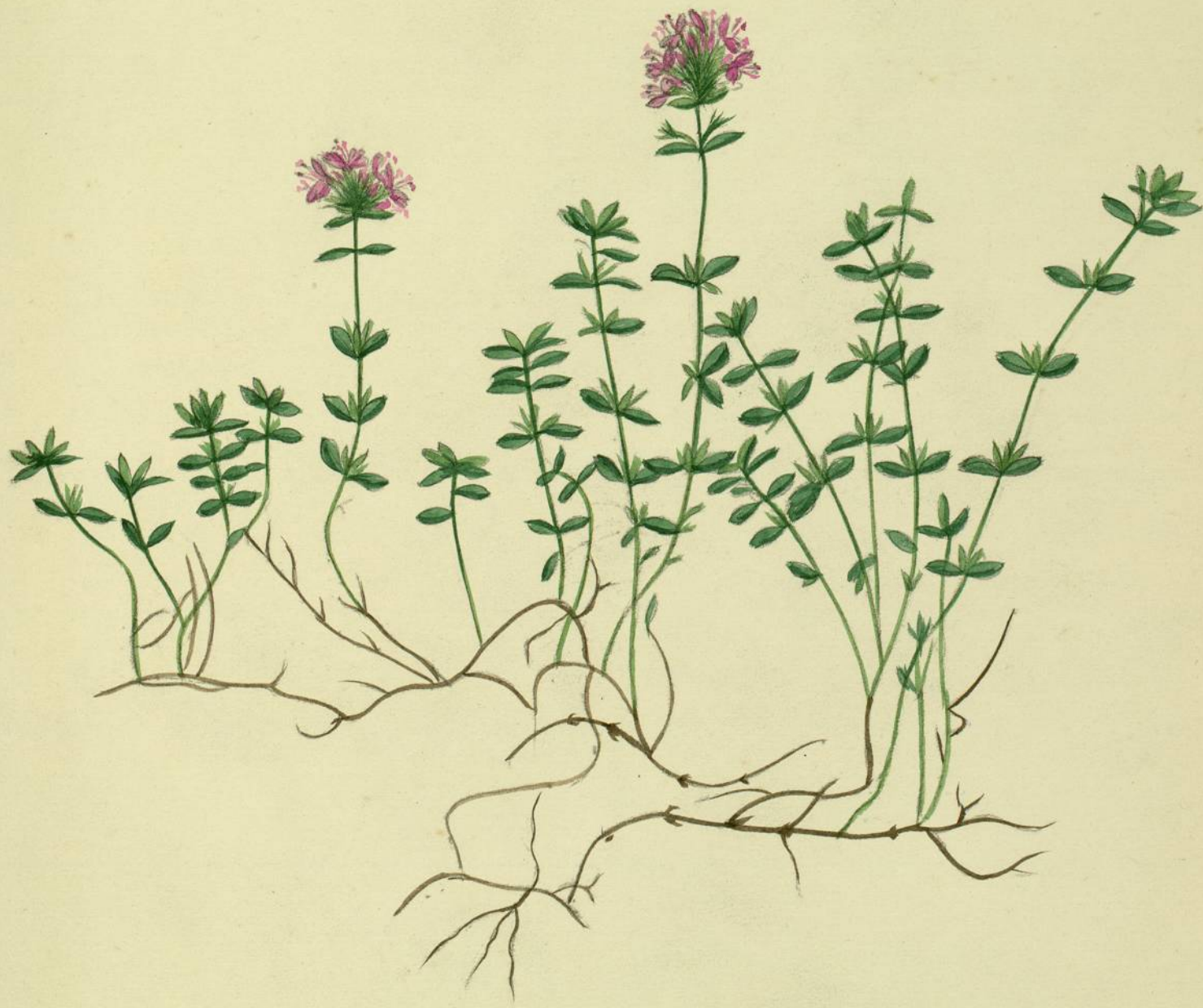
Thymus Serpyllum. (Linné.) Bois de Serres.