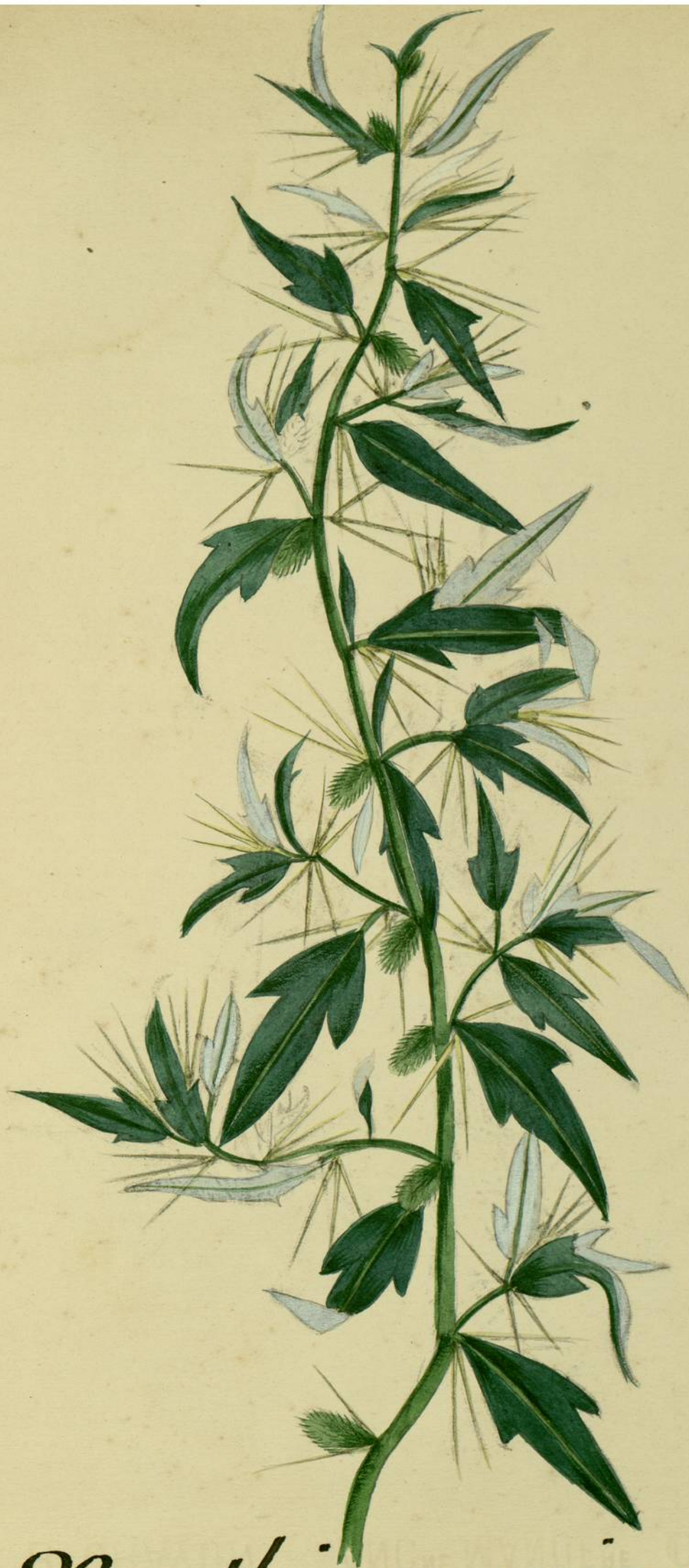
Xanthium spinosum. (Linné.) Carcassonne, bords de l'Aude