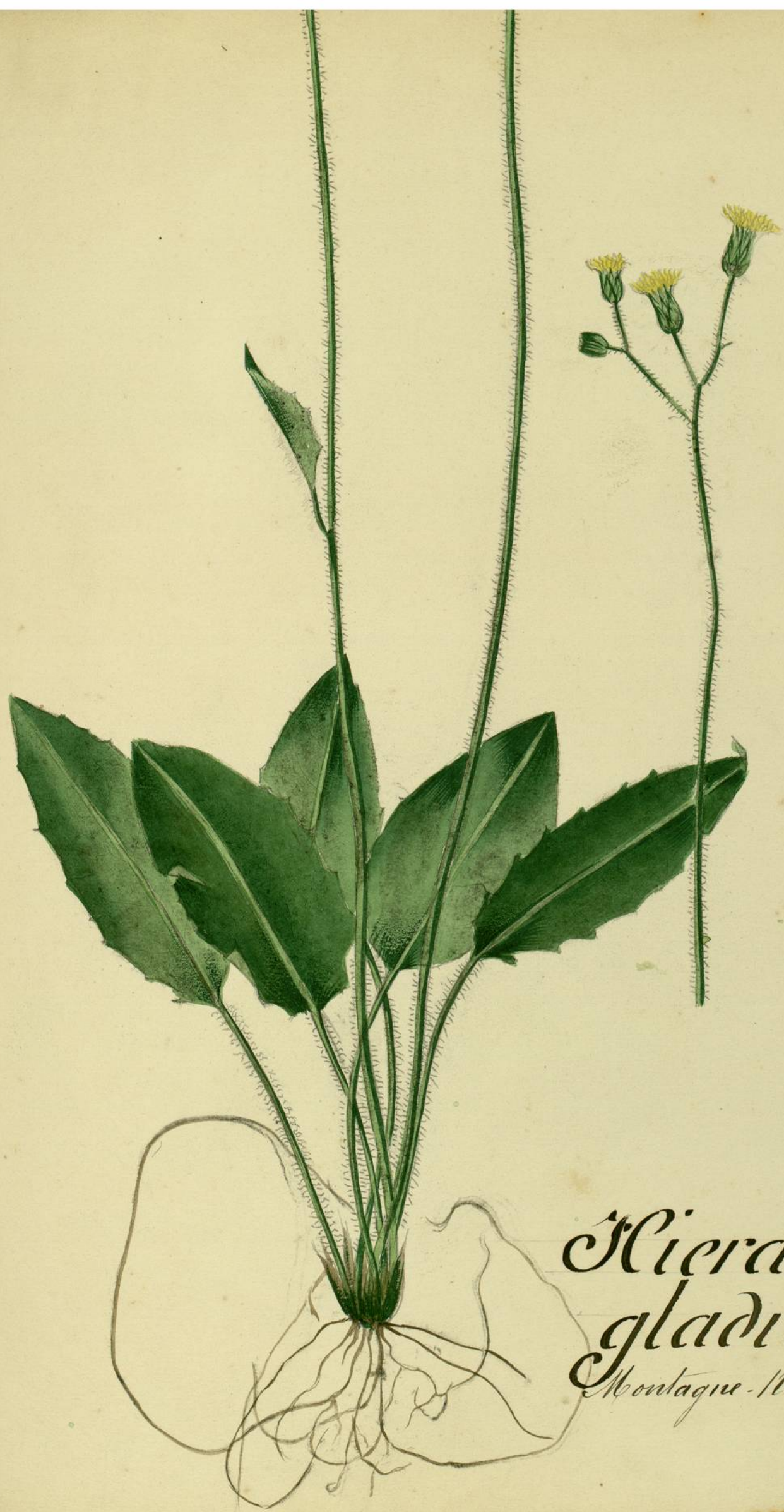
Hieracium gladiatum. Montagne-Noire. (Martin Doros)