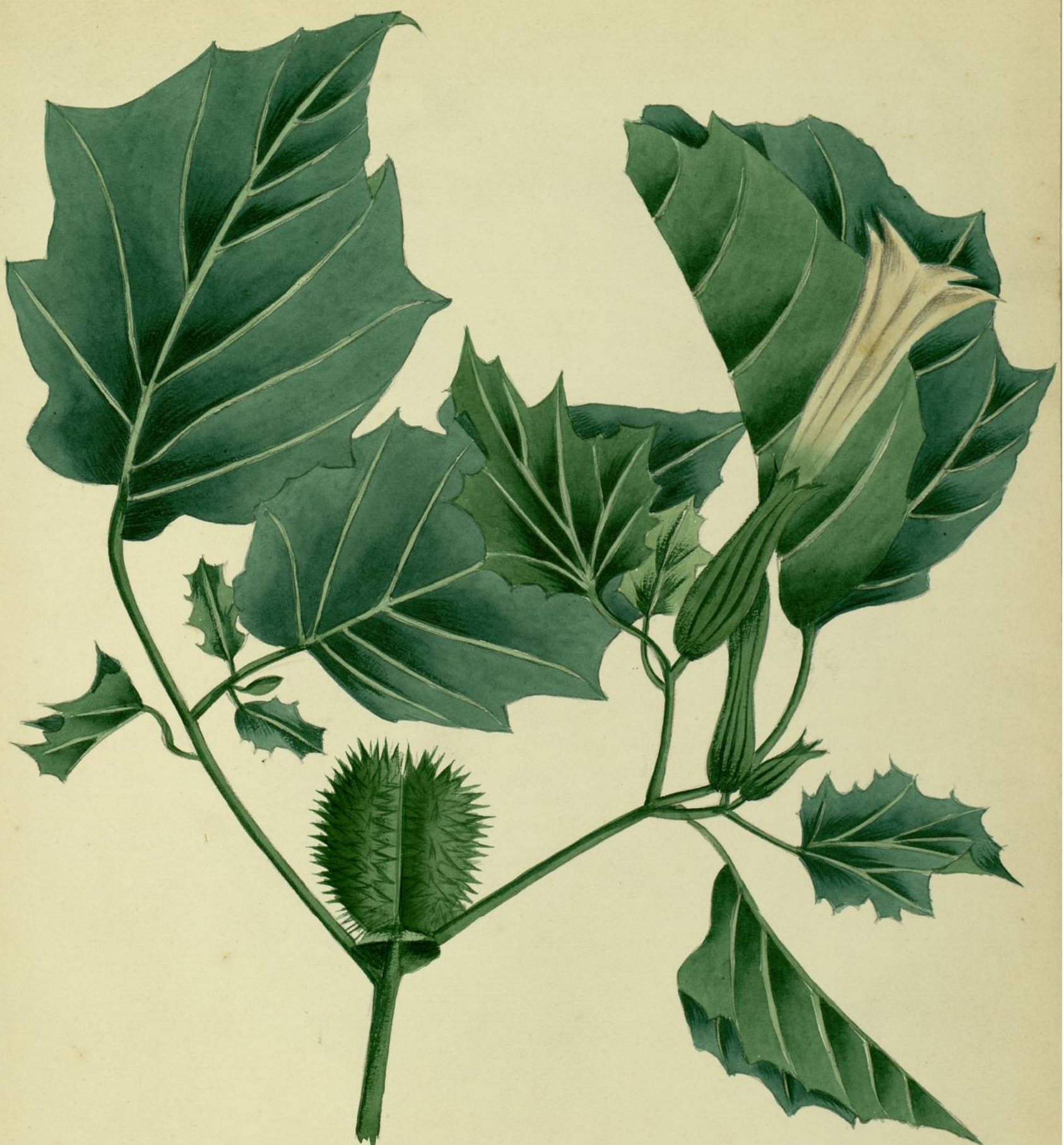
Datura Stramonium. (Linné.) Carcassonne, décombres.