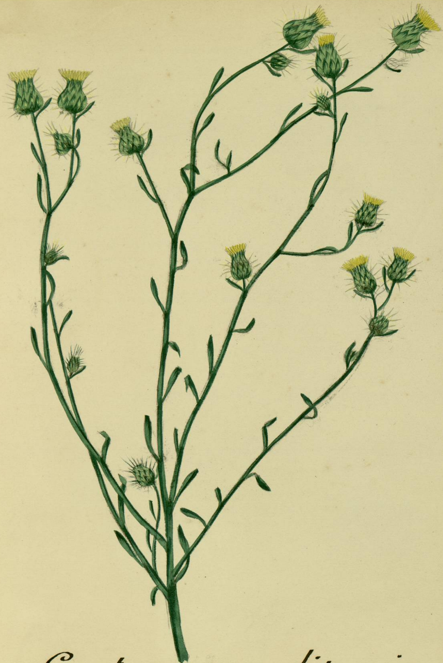
Centaurea melitensis. (Linne.) Carcassonne, endroits incultes.