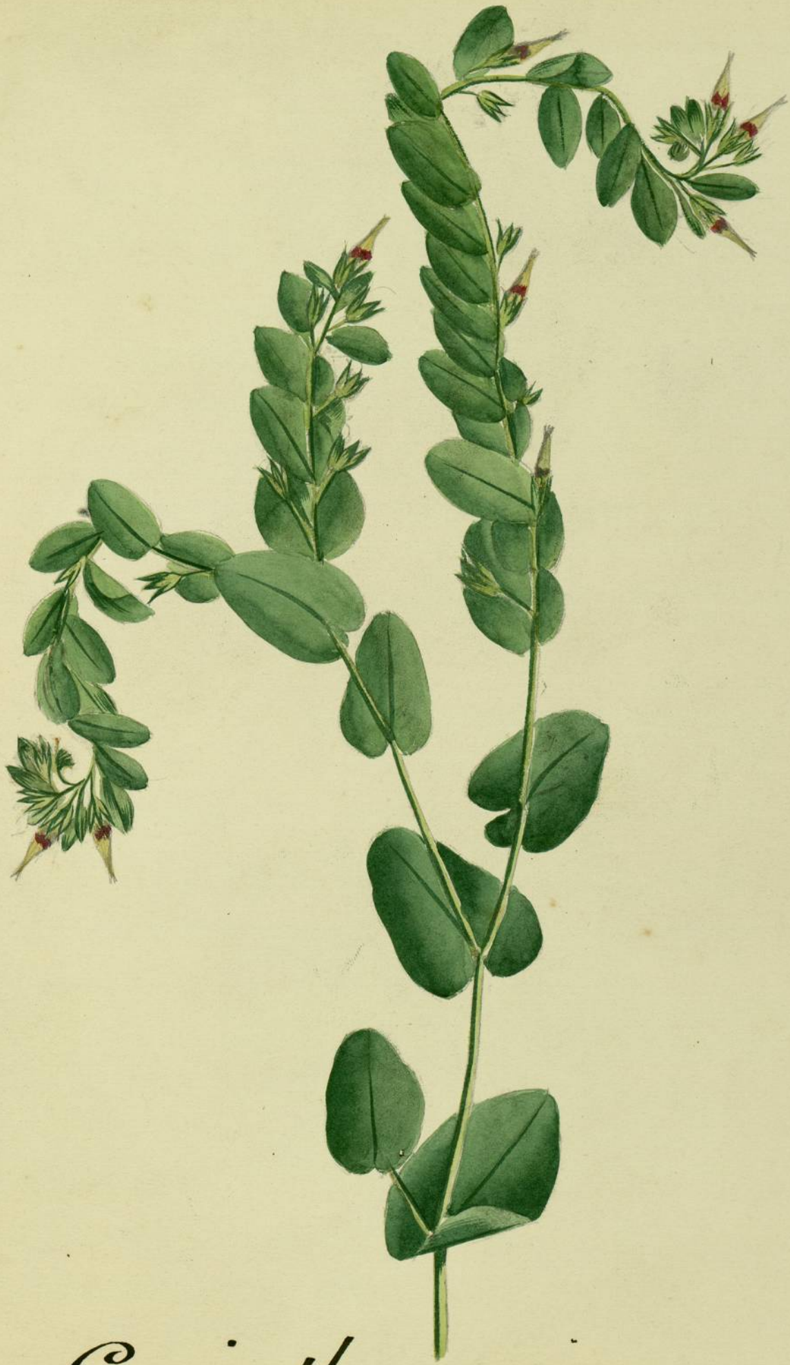
Cerinthe minor. (Linné.) variété maculata. (Linné.) Champ, près du pont-d'artiques.