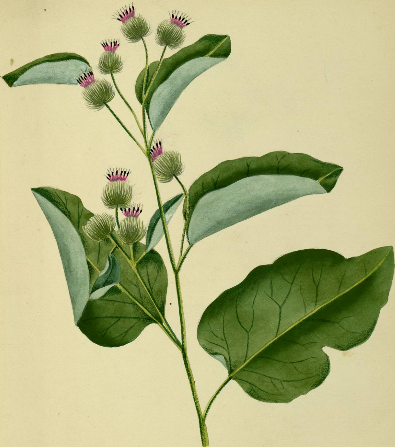
Lappula communis. (Linné.) Carcassonne, endroits incultes.