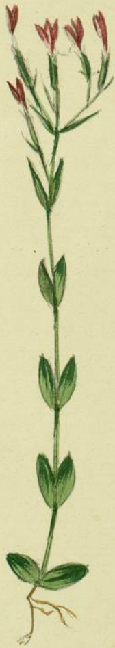
Erythraea pulchella. (Kornemann.) Carcassonne, Alibert.