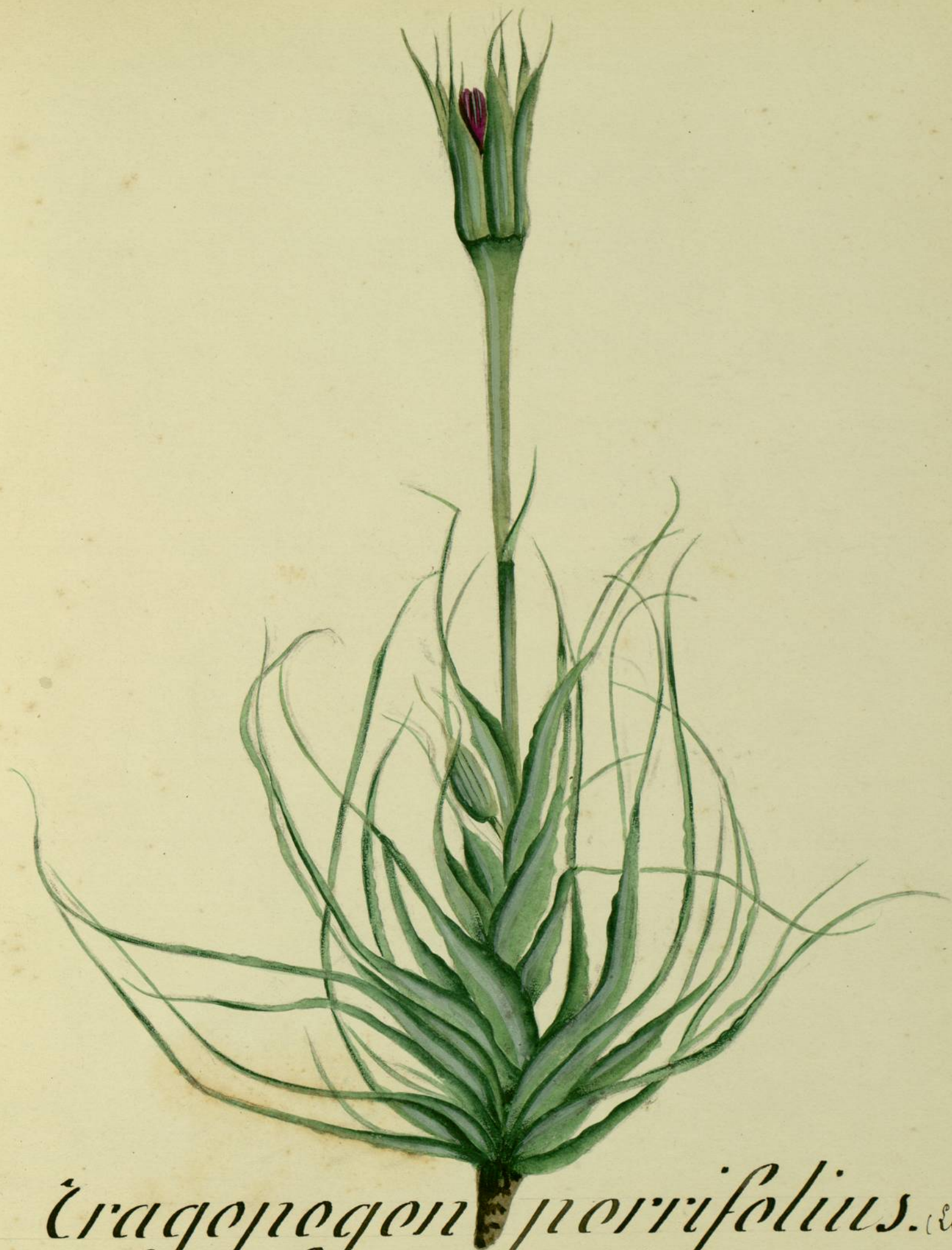
Tragepogon perfoliatus. (Linné.) Carcassonne, près.