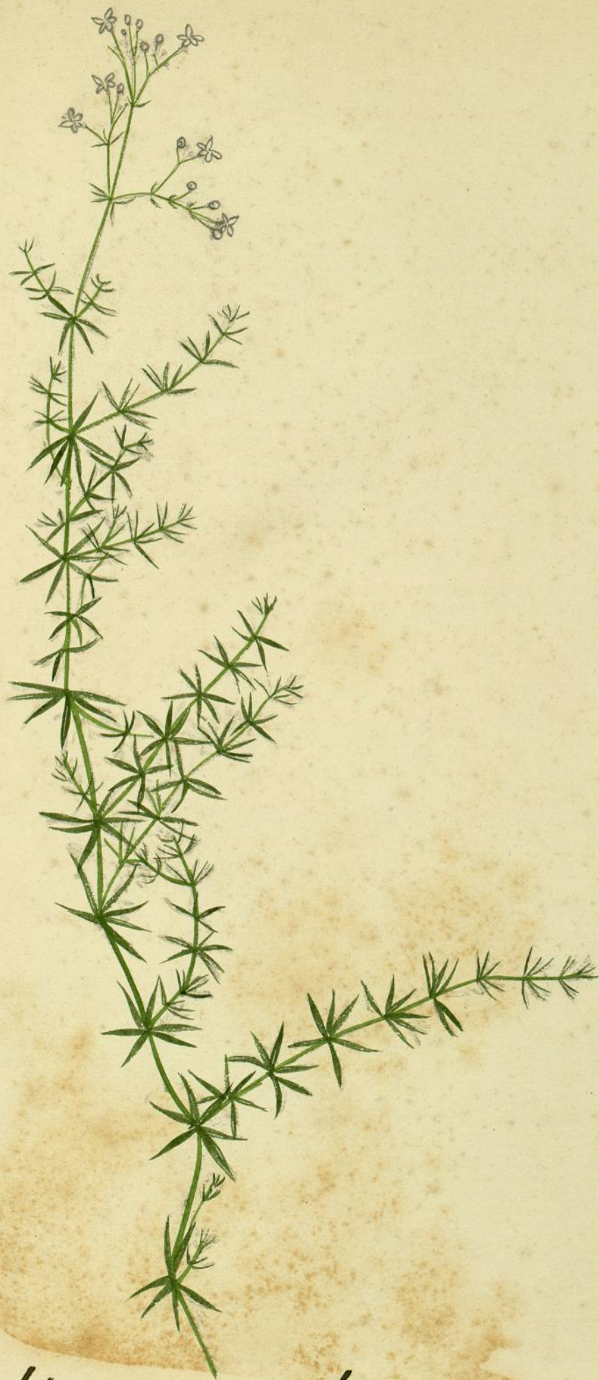
Galium sylvestre (Pollich.) variété sudeticum. (Wausch.) Environ de Gindes.