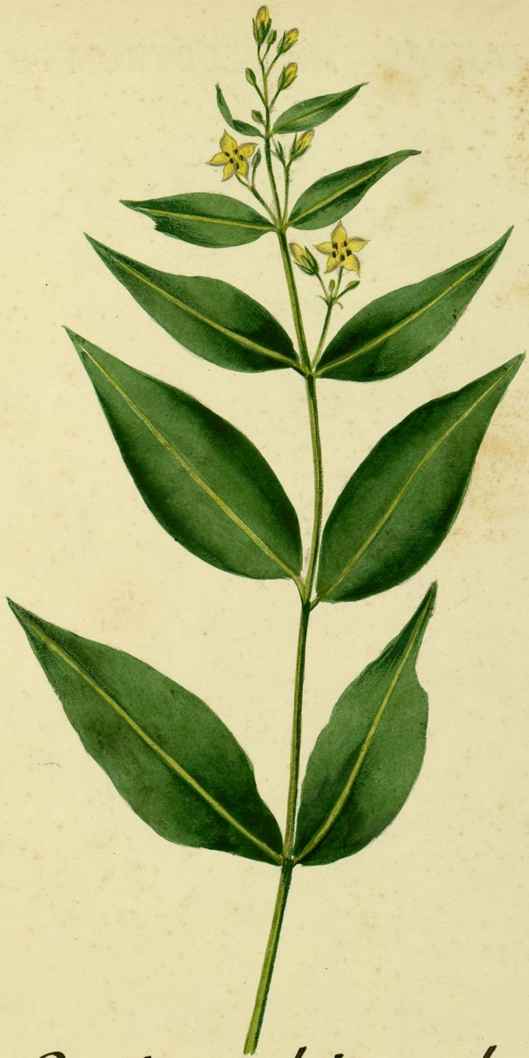
Lysimachia vulgaris. (Linné.) Carcassonne, endroits humides.