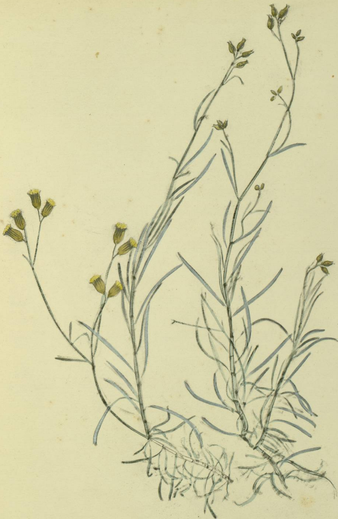
Shagnalon serpidium. (De Candolle.) Carcassonne, lieux incultes.