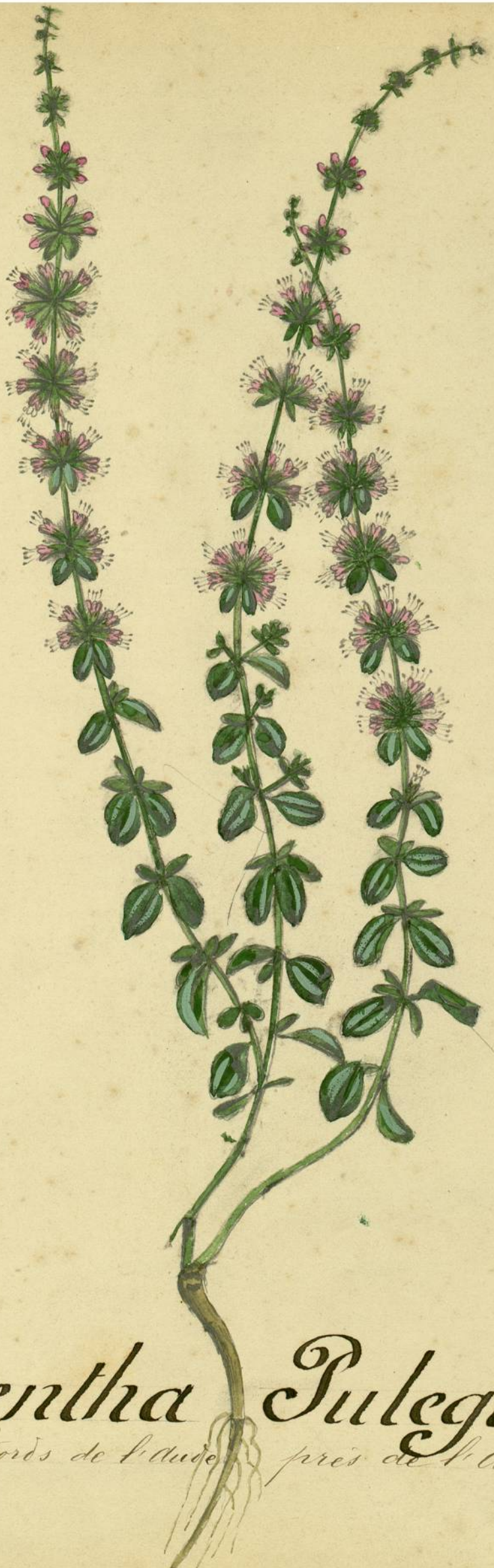
Mentha Pulegium. (Linné.) Bords de l'Aude près de l'Abattoir.