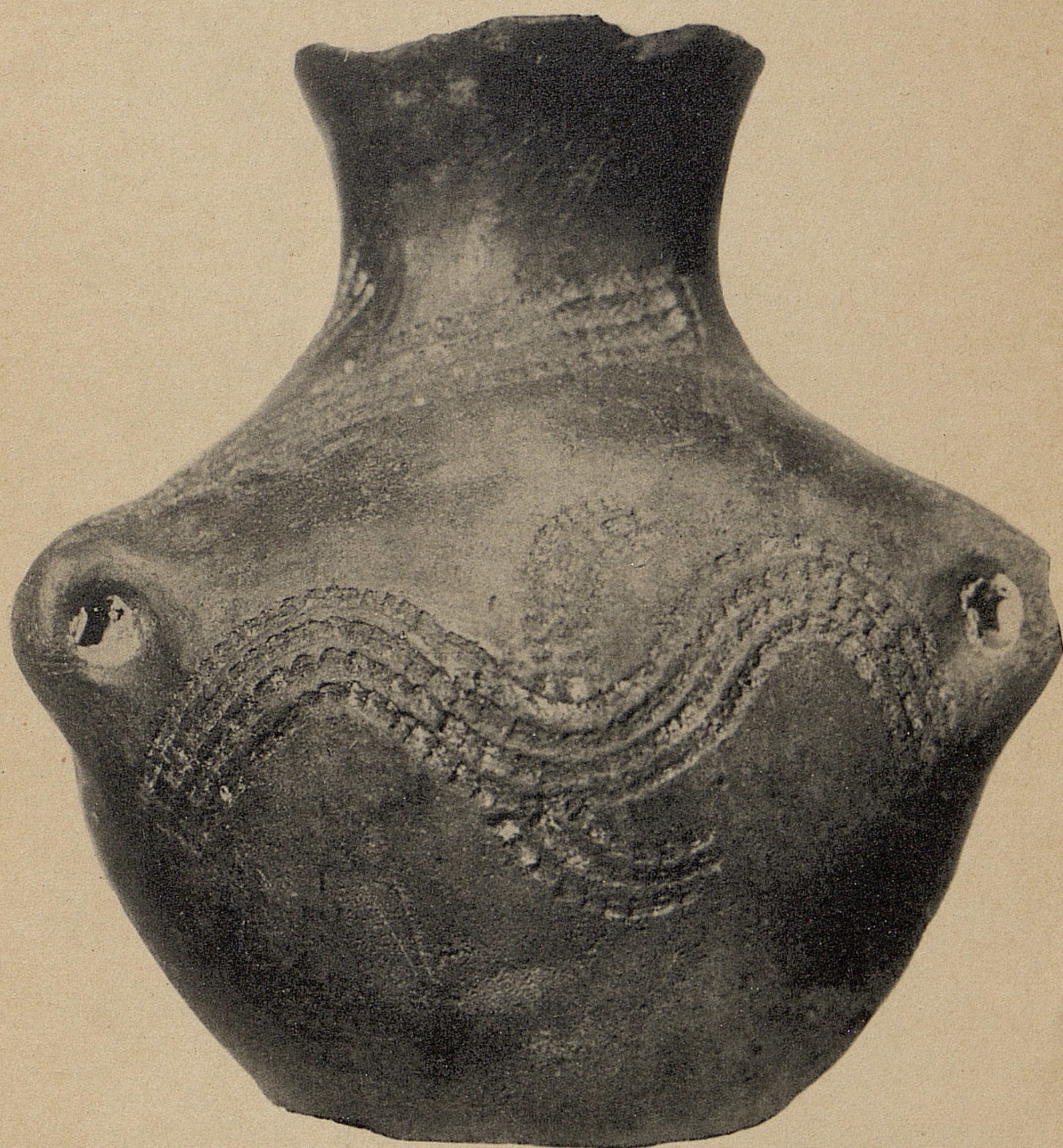
LE VASE DE BELLOY