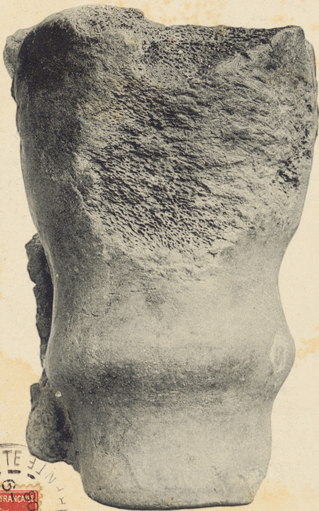
Humérus de Bison utilisé.