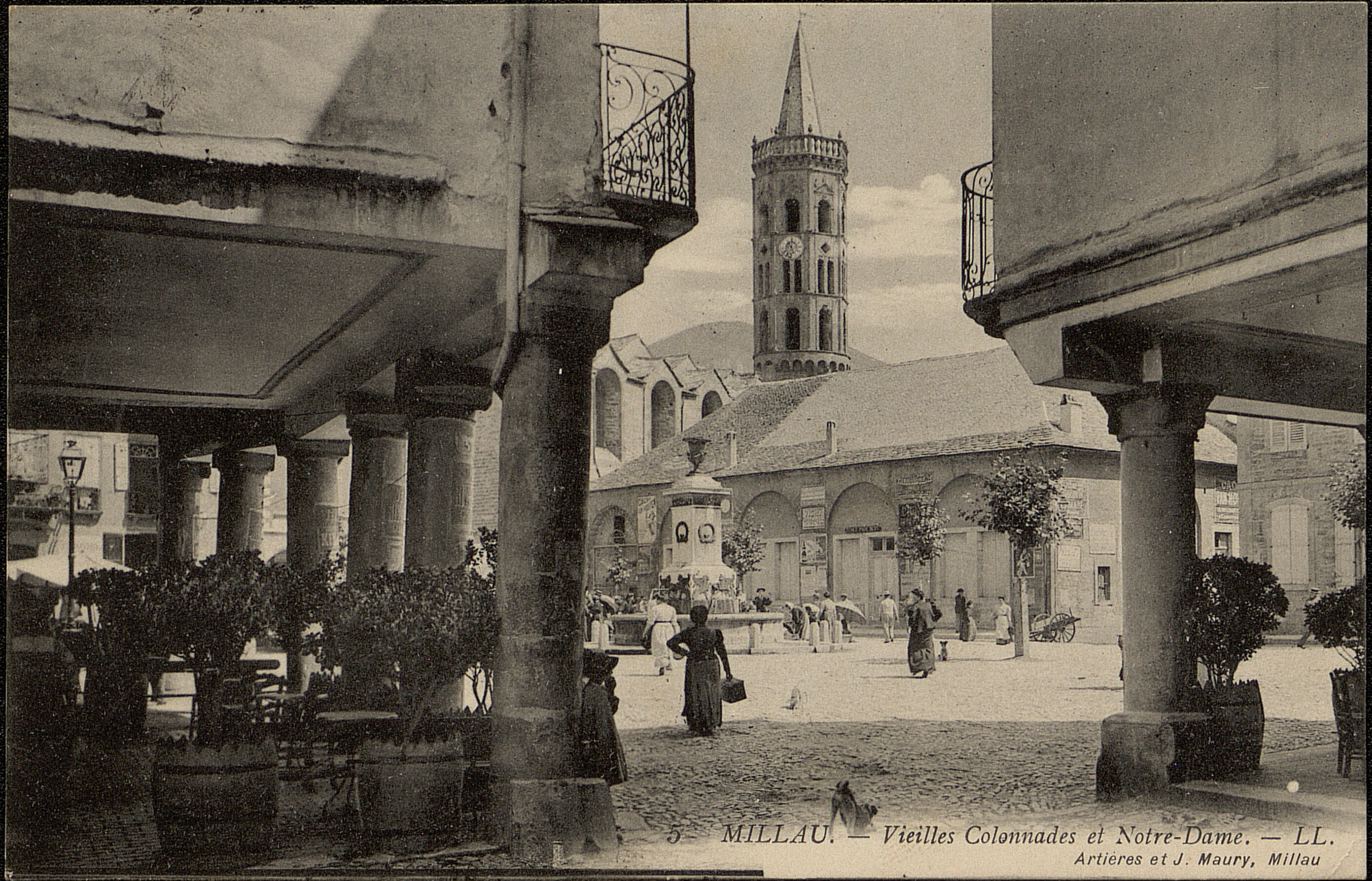
5 MILLAU. — Vieilles Colonnades et Notre-Dame. — LL. Artières et J. Maury, Millau