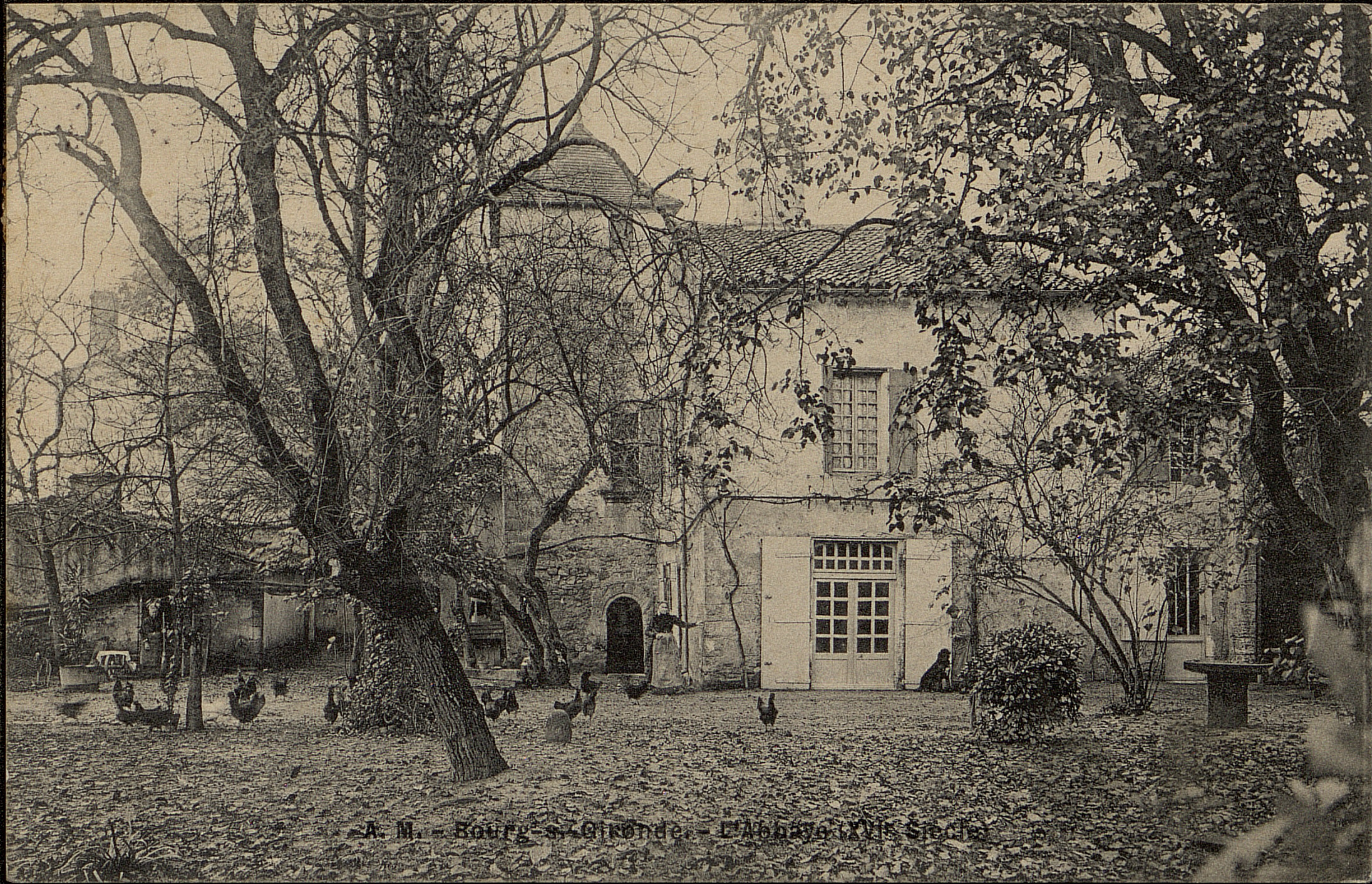
A. M. - Bourg-s.-Gironde. - L'Abbaye (XVII e Siècle)