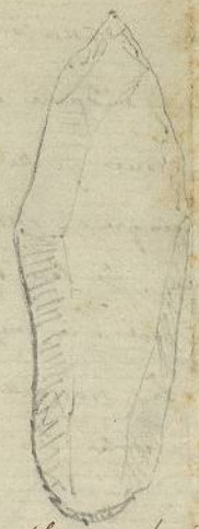
Fleche se fixe à l'oppositif