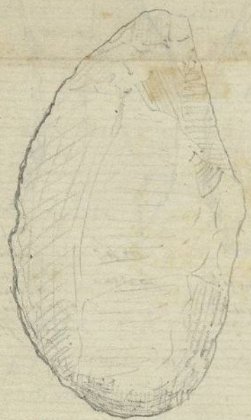
Raclois par enbas Couteau tranchant à gauche Enmanchure par en haut