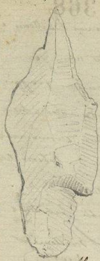
Pointe de fleche avec enmanchure