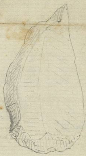
Couteau raclois tranchant à droite Raclois par en bas

loutes les faces se se frotte sans limes