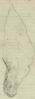
pointe avec en manchure